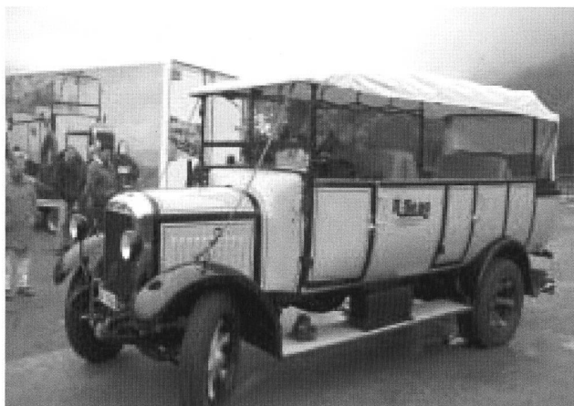
Unbestrittener Star der Ausfahrt: Röllins mit ihrem FBW-Gesellschaftswagen – standesgemäss im eigenen Trailer angereist!