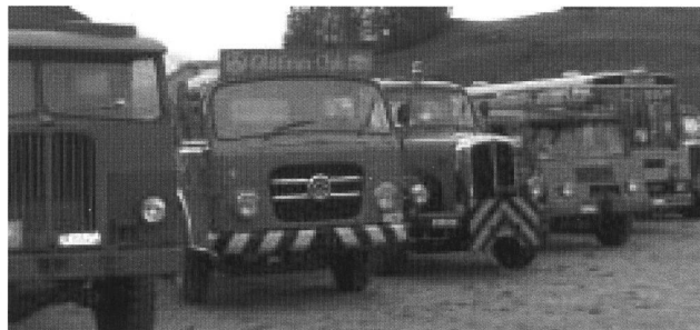
Eine herrliche Oldtimerparade! (Mittagspause in Disentis)

eigentlich berichten? Am besten ist wie meist: lasst Bilder sprechen!