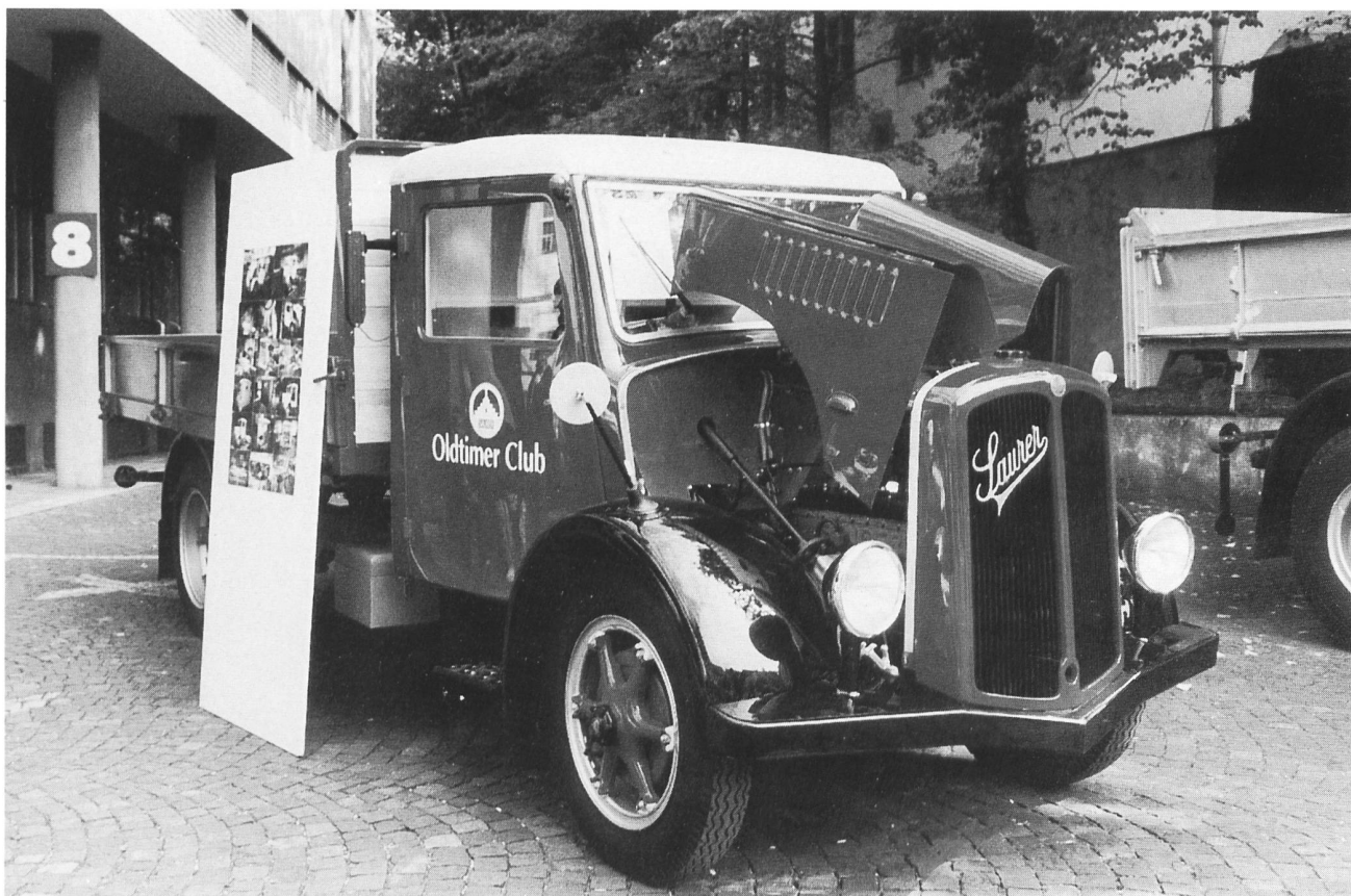
Saurer LC2 mit Benzinmotor CA, Jahrgang 1936