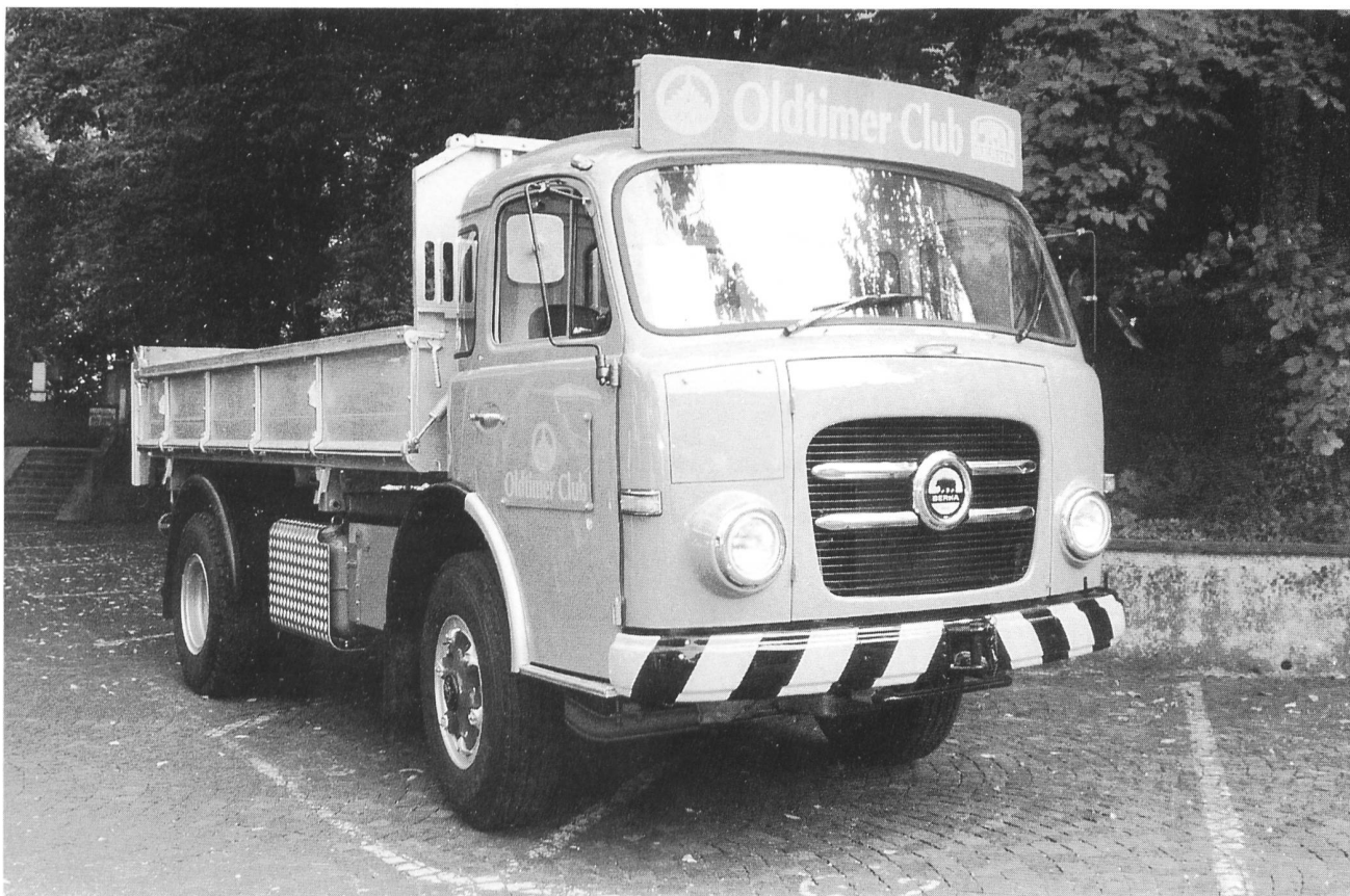
Berna 5VF mit Motor D1KL, Jahrgang 1971

Da wir natürlich auch ein wenig stolz auf unsere Fahrzeuge sind, beschriften wir sie neu mit unserem Signet.