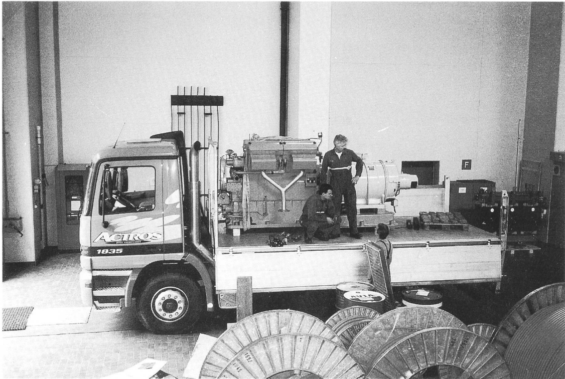
Auf dem Transport nach Schlieren ...