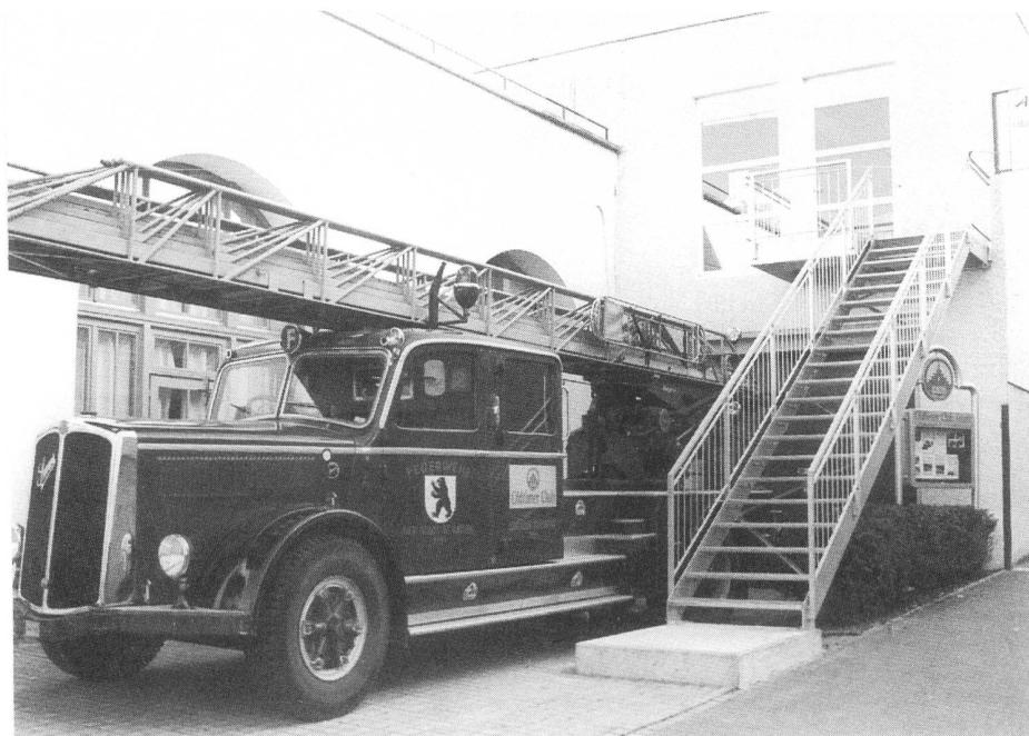
Bild: Neuer Zugang mit N4C Feuerwehrdrehleiter.

Auch 1997 erfreuten sich verschiedene Besucher aus dem Ausland und der Schweiz an unseren Exponaten im Museum. Die Gruppe mit dem längsten Anfahrweg kam aus Sandvik einer Stadt 200 km nördlich von Stokholm!