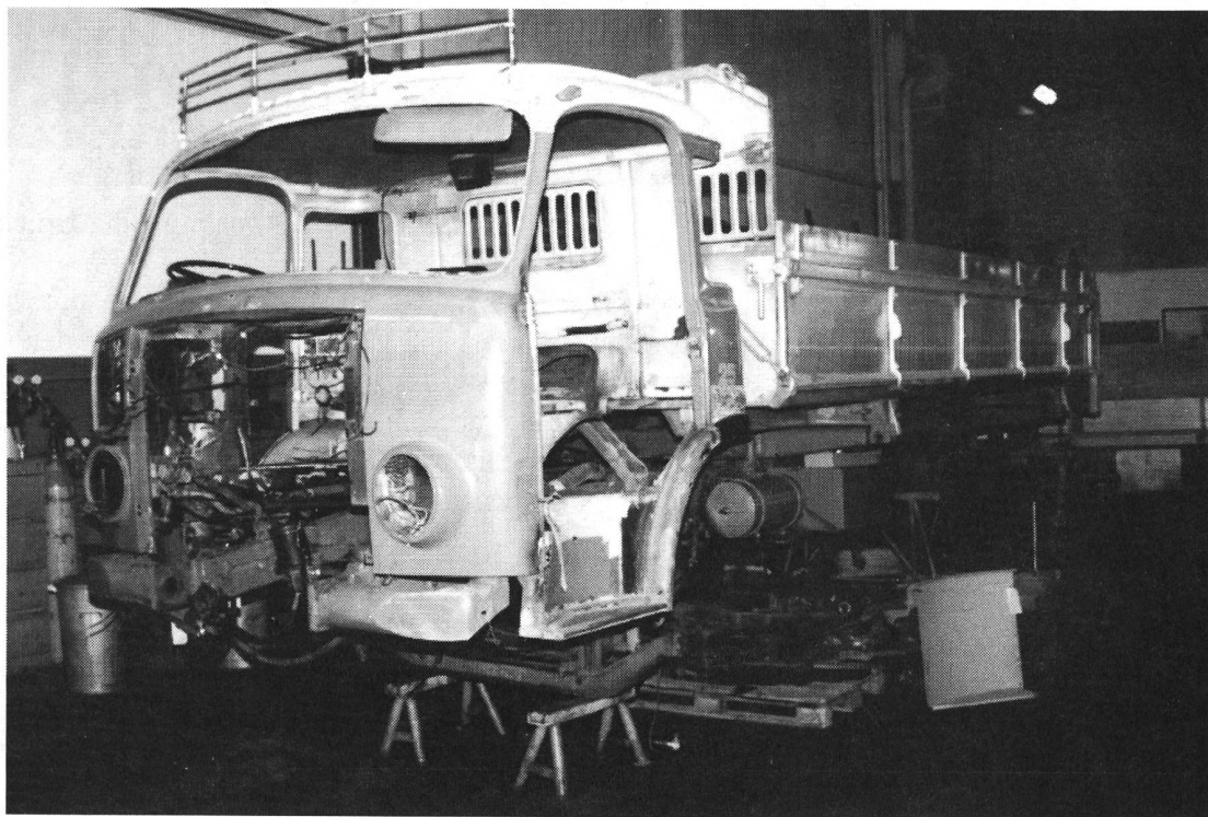
Berna 5VF in Arbeit

In der letzten Gazette habe ich geschrieben, dass wir Sponsoren für einen Berna 5VF Kipper suchen. Angeschrieben worden sind Firmen, die als Zulieferer, Servicestelle oder Kunde mit Saurer in Verbindung waren, grössere Firmen in der Umgebung von Arbon und grosse Unternehmungen die in der ganzen Schweiz bekannt sind, wie Banken, Versicherungen,... Angaben zu den Sponsoren findet Ihr weiter hinten. Die Beiträge ergeben noch keine Fr. 30'000.-, da aber der Spendeneingang recht erfreulich aussieht und sicher noch die einen oder anderen Beiträge eingehen werden, haben wir die Instandstellung gestartet.