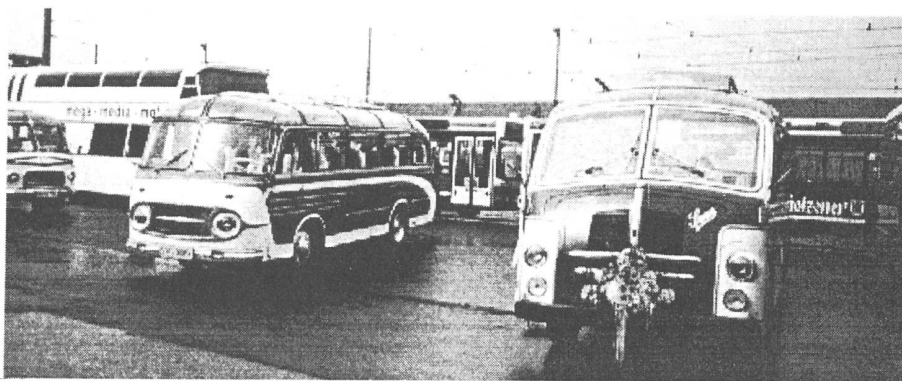
Busbetriebshof Ost München

18.00 Korso durch München, Ostbetriebshof nach der Theresienwiese Fahrzeit ca 45 Min im 20 km Tempo. Plötzlich wurde der (7) von Personen bestürmt um mitzufahren. Mit der Nr. 0 fuhr ein Benz Jahrgang 1935! Der Reichspost aus dem Museum. Dann folgte vom OCM ein schön restaurierter Stadt-Bus MAN Typ 750. Nachher der einzige SAURER an diesem Treff S 2c-H 1951 als Nr. 1 (Altershalber oder weil der Car als einziger Bus mit Blumen geschmückt war ? !