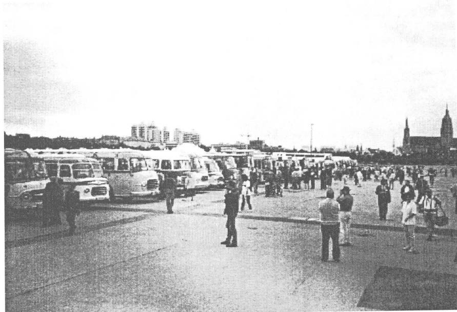
Theresienwiese im hintergrund der Zirkus

Die Zeit war im Fluge ver- strichen..... leider... ..