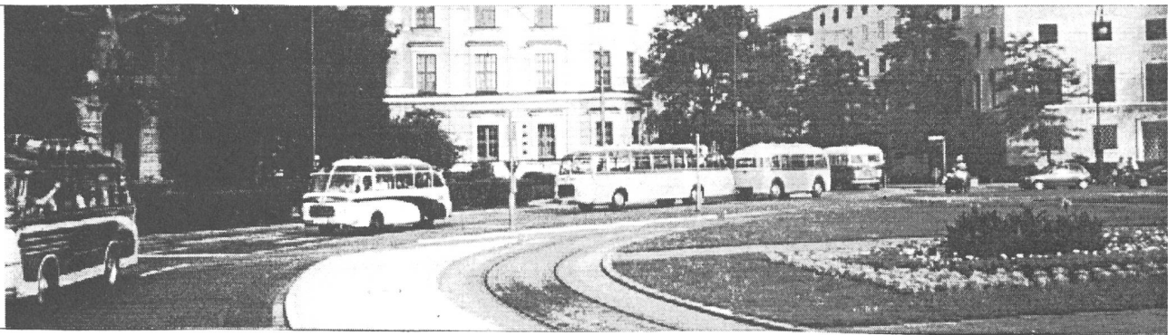
Korso am Karolinen-Platz Obelisk

Am Korso waren die 30 Oldtimer der Marken MAN, Benz, Mercedes, Neoplan Daimler-Benz, Setra, Ikarus, Doggenmöller - und ein SAURER aus der Schweiz. Welch ein Stolz für den Chauffeur !