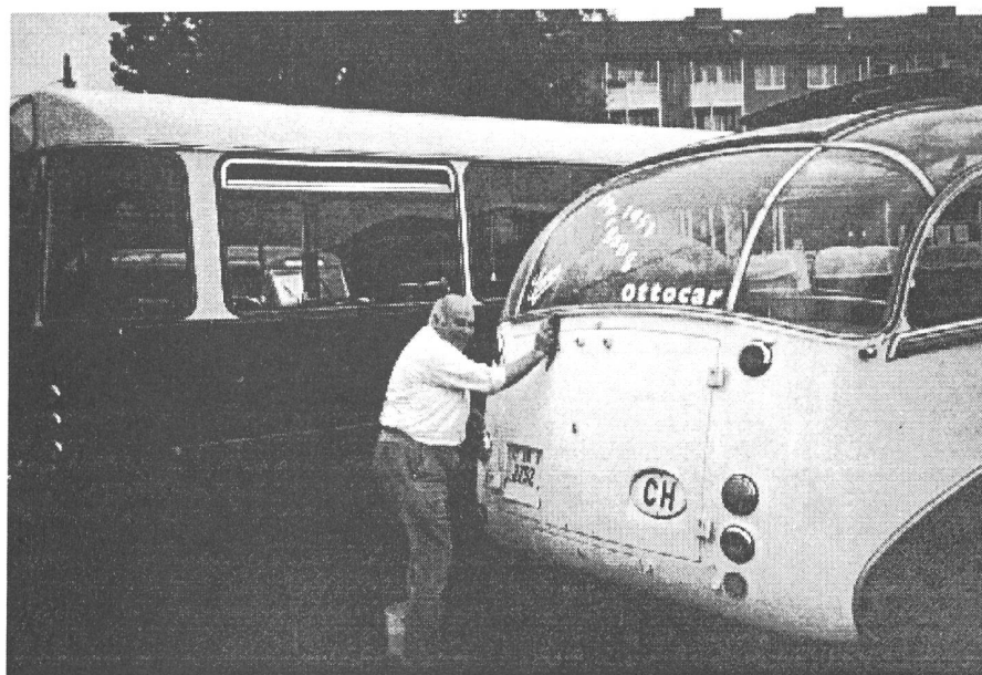
Gutgelaunt wird die Hand-Reinigung in kauf genommen.

Beifahrer Pesché Foto, Otto Besitzer des Saurer 1951 sagen nochmal Danke. Es waren 7'000 Besucher anwesend.