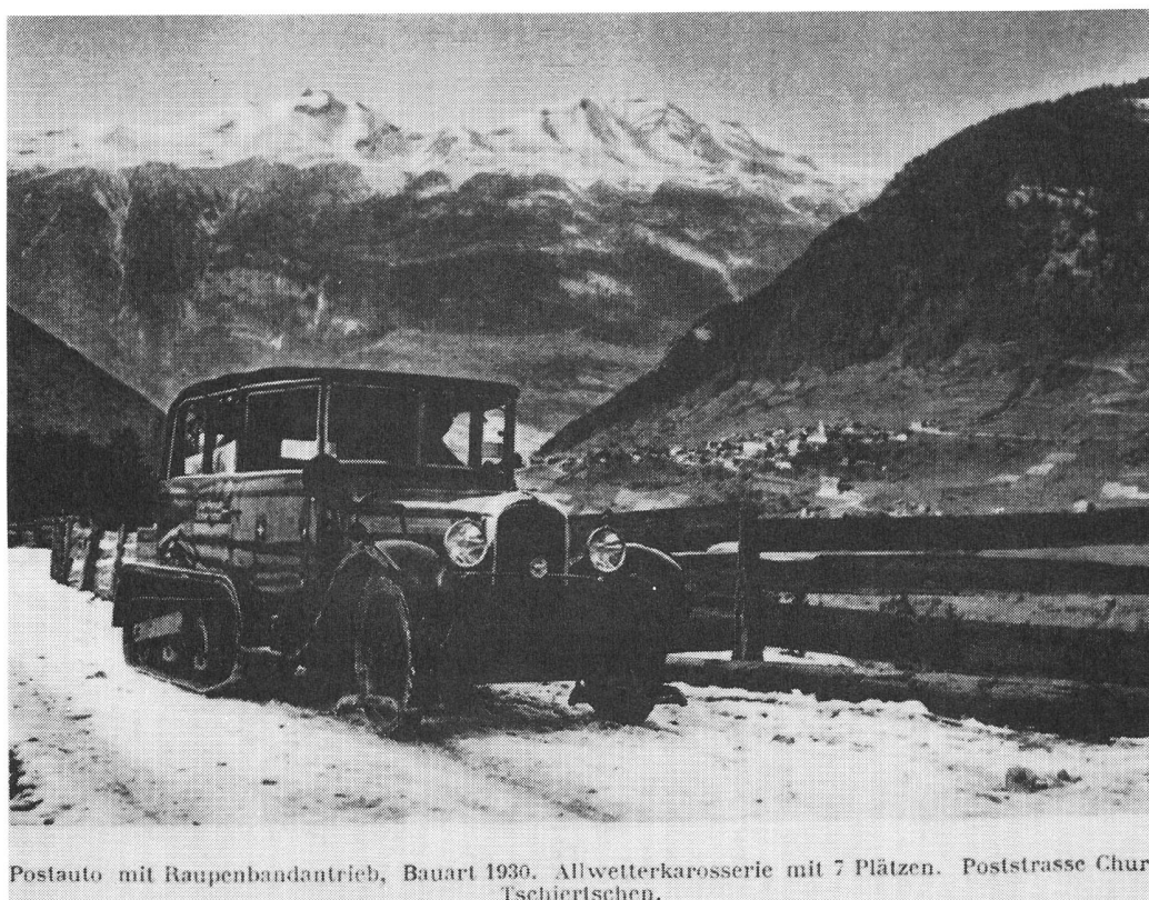
Postauto mit Raupenbandantrieb, Bauart 1936. Allwetterkarosserie mit 7 Plätzen. Poststrasse Chur-Tschiertschen.