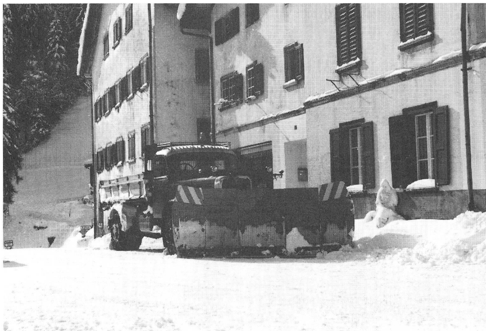
Saurer 5D 1963 : Beinahe 25 Jahre im haertesten Einsatz. Hauptsaechlich im Safiental.