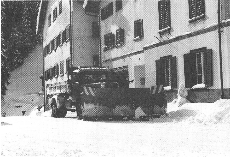
Saurer 5D 1963 : Beinahe 25 Jahre im haertesten Einsatz. Hauptsaechlich im Safiental.