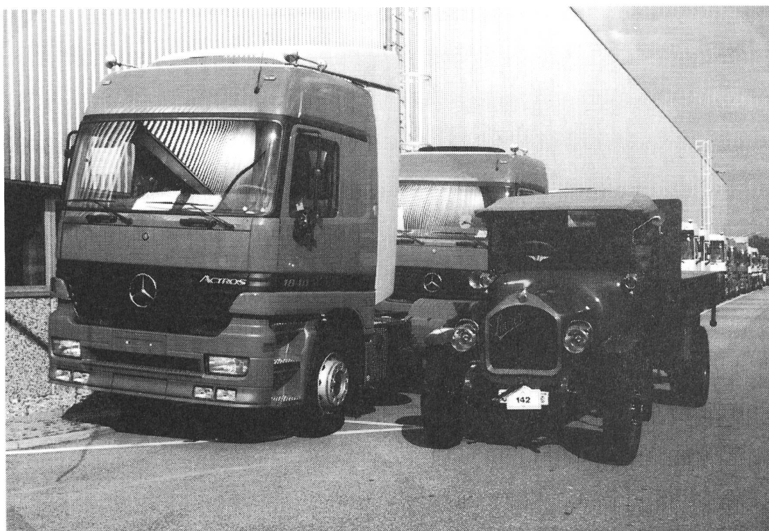
Mercedes Actros mit Saurer 3TC, 1916 bis 1996, 80 Jahre Unterschied

Nebst diesen mustergültig aussehenden Veteranen war die schweizerische Nutzfahrzeug-Industrie mit einer Vielzahl jüngerer, sehr gut präsentierender Fahrzeugen von Berna, Saurer und FBW bestens vertreten.