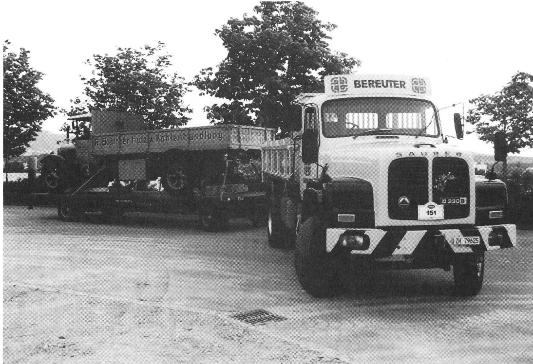
Saurer 5AE beim Rücktransport