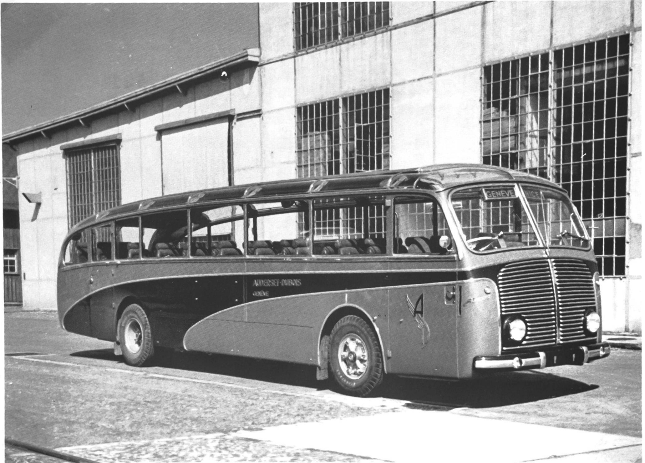
Saurer 5H-Reisebus der Firma Auderset-Dubois, Genf. Einsatz im Kursverkehr Genf-Nizza mit Bordbar und Toilette. 8-Zylinder-CH2DLM-Heckmotor mit 220 PS, quer eingebaut. (Angaben Saurer Arbon.)