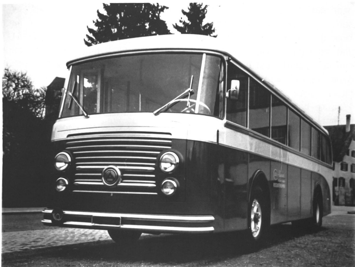
Saurer 4H, Motor CT2D mit 125 PS, Baujahr 1952 Geschwindigkeit 78 Km/Std. Verwendung als: Kurswagen Platzzahl: 34