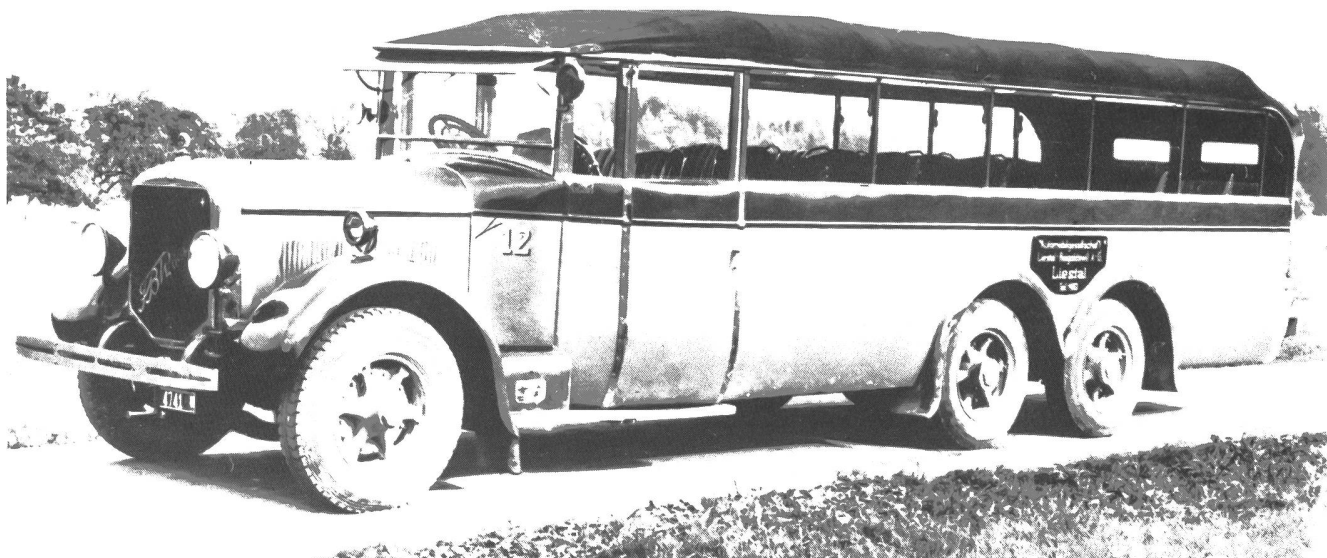
FBW/Seitz (N) 6R 4t Henschel 6/115x160 Omnibus (1929) der Automobilgesellschaft Liestal-Reigoldswil AG

Das ist ein Bild aus dem 1996er Kalender! Was aber zeigen die anderen 12 Fotos? Wo wurden sie aufgenommen?