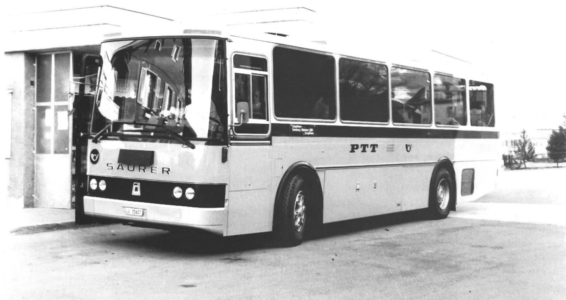
Bild unten: Saurer RH 525-23 D3KTU-B Bauj.1982 Carrosserie Ramseier/Jenzer. PAH A.Schnider, Schüpfheim