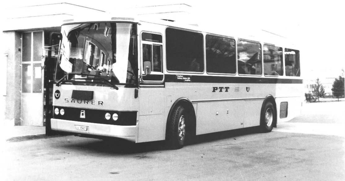
Bild unten: Saurer RH 525-23 D3KTU-B Bauj.1982 Carrosserie Ramseier/Jenzer. PAH A.Schnider, Schüpfheim