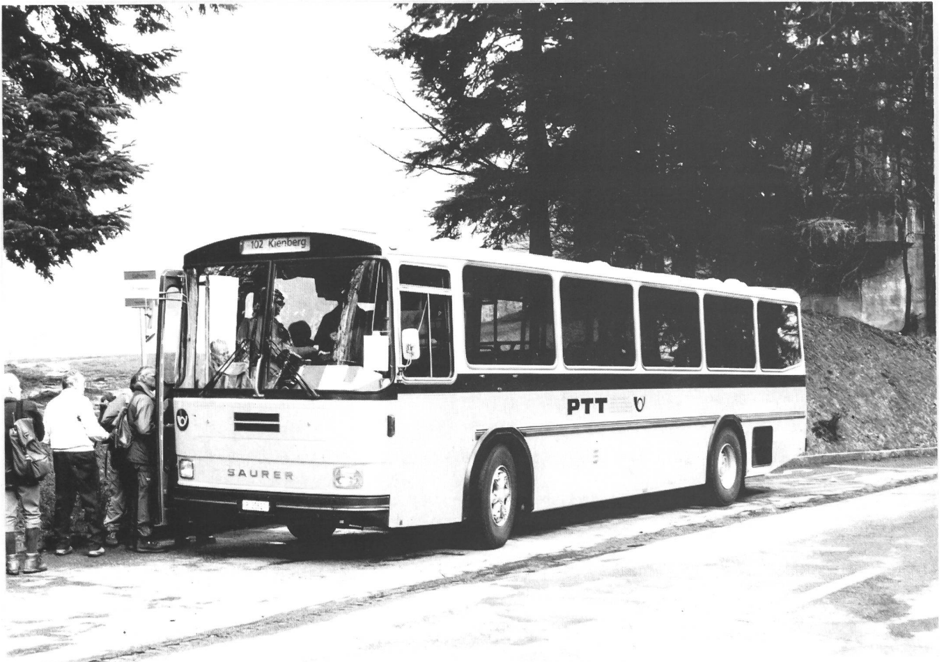
Bild oben: Saurer RH 580-25 D3KTU-B Bauj.1982 P-25820 Carrosserie Tüscher