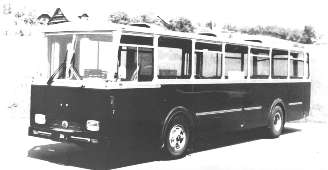
Bild unten: Saurer 5 DUK D1KU Bauj.1972.Carrosserie Hess. Wagen Nr.7 der Rottal Auto AG