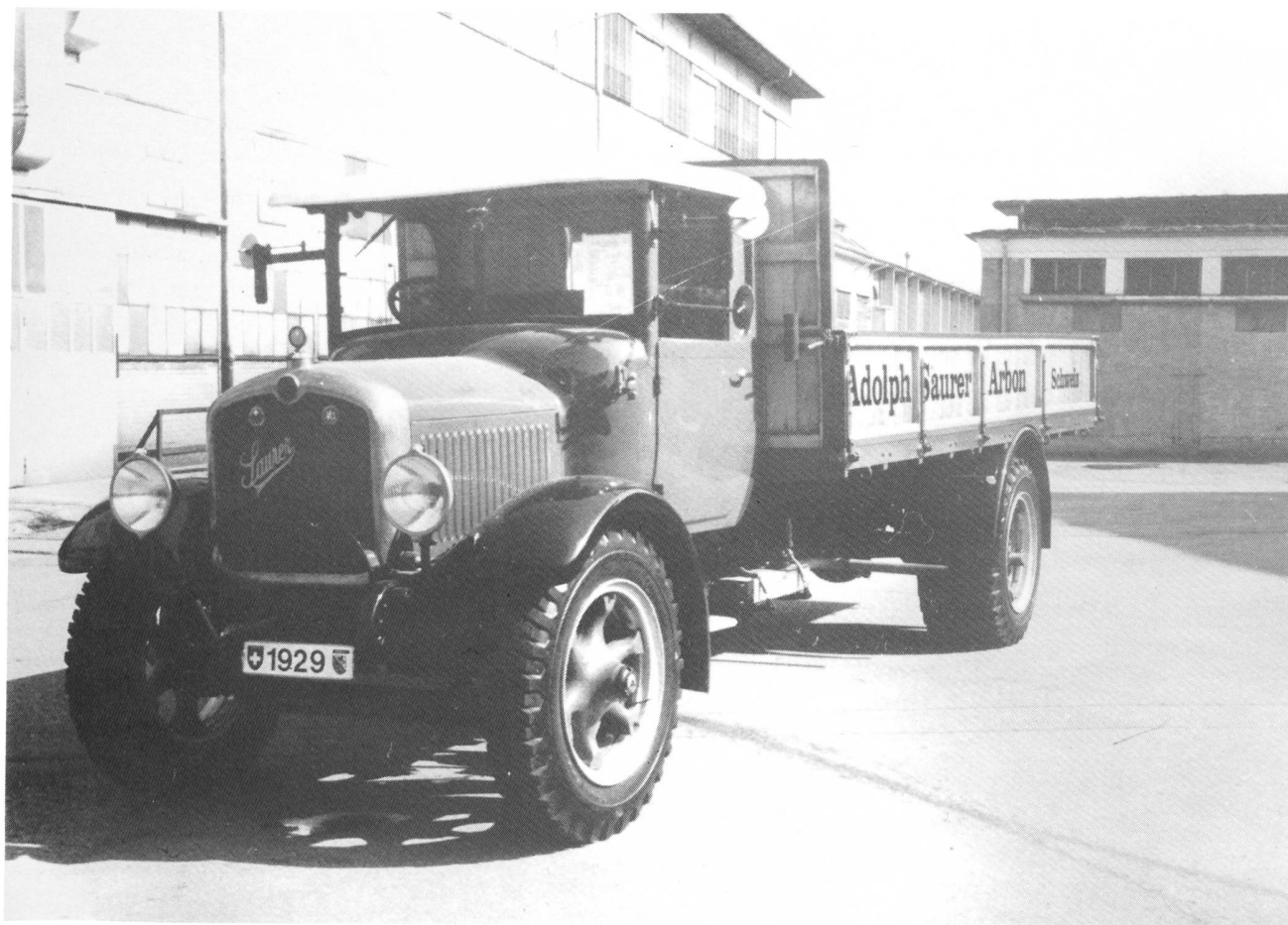
Saurer 5ADD Jahrgang 1929

Es gibt sehr wenige Vereine, die sich um den Erhalt von technischem Kulturgut kümmern, wir zeigen vollen Einsatz!