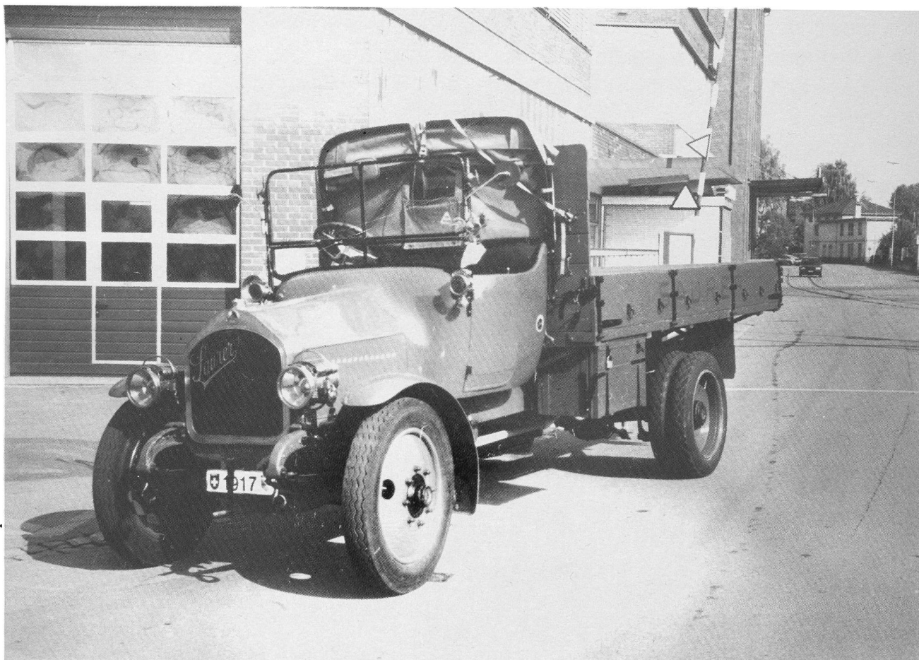
Saurer 3TC, Jahrgang 1917