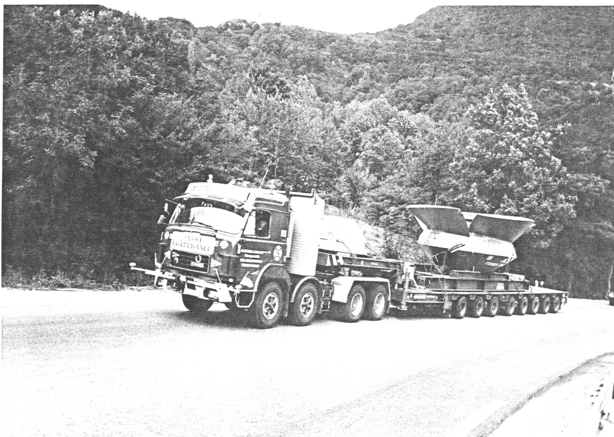
Einer der Transporte von Otto Zuber, unterwegs nach Barcelona.