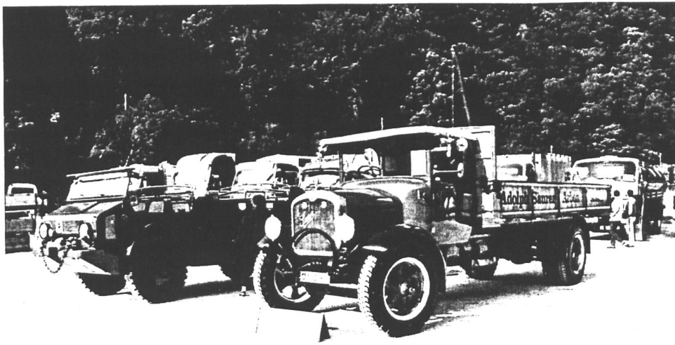
Saurer 4MH, 5ADD