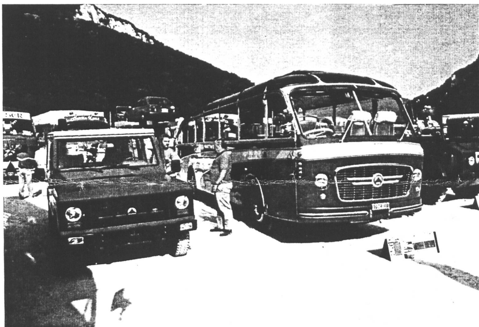
Saurer V2H, Jeep