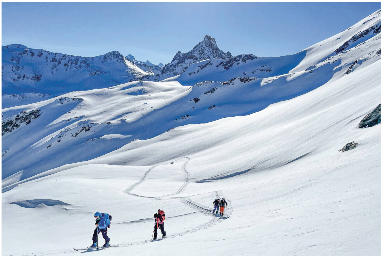
Kurz vor der Fellifurgga – hinten Niwen und Faldum-Rothorn. Den vollständigen Tourenbericht findet ihr auf www.sac-bern.ch .

Eidgenössische Jagdbanngebiete: Im Kanton Wallis wurde bei La Fouly eine Schneeschuhroute ergänzt.