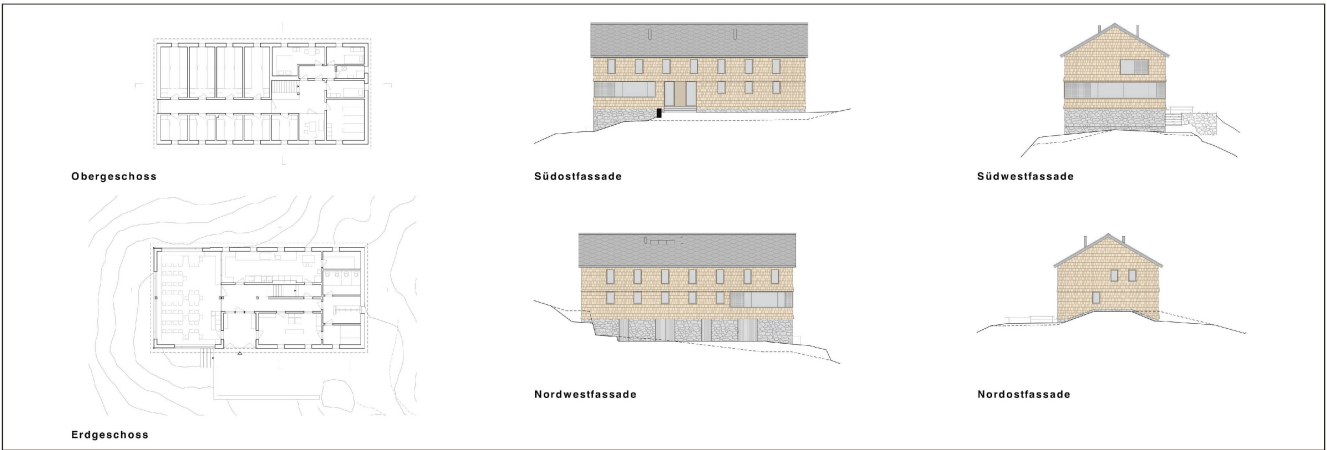
Projektpläne © Werkgruppe agw Bern