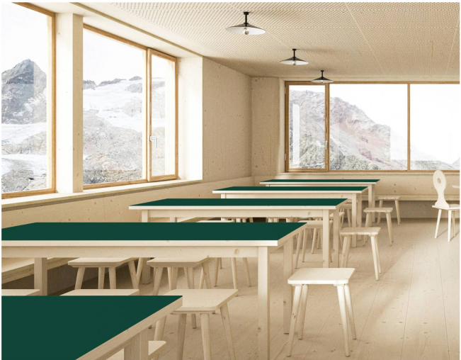
Visualisierung EG – Aufenthaltsraum