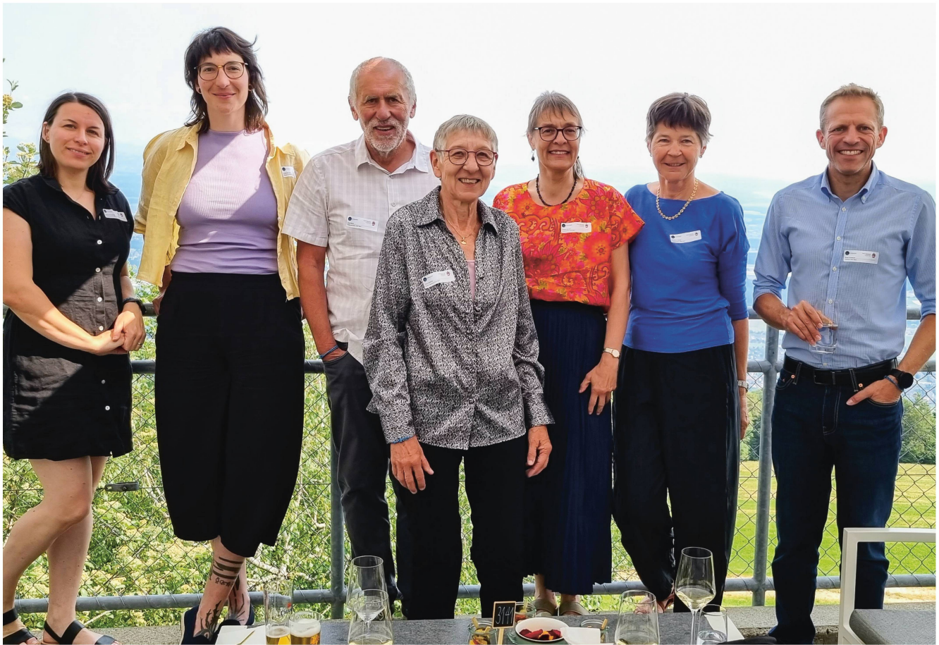
Die sieben Delegierten des SAC Bern.