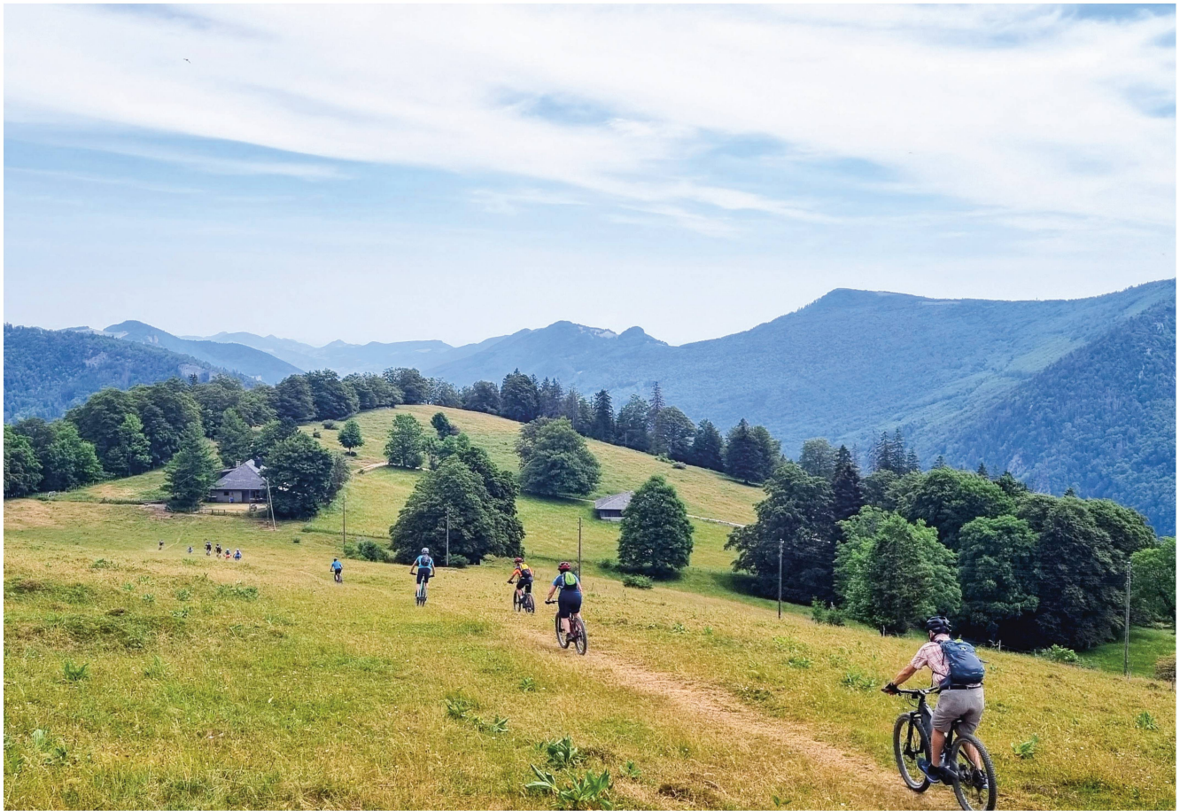
Das Wetter spielt mit beim vielseitigen sportlichen Programm des SAC Weissenstein.