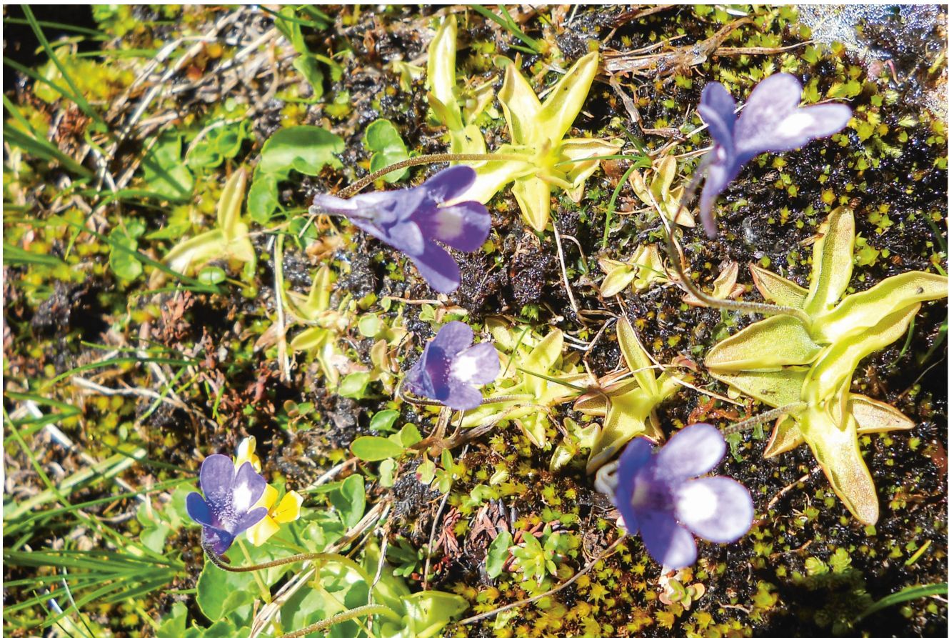
Dünnsporniges Fettblatt.