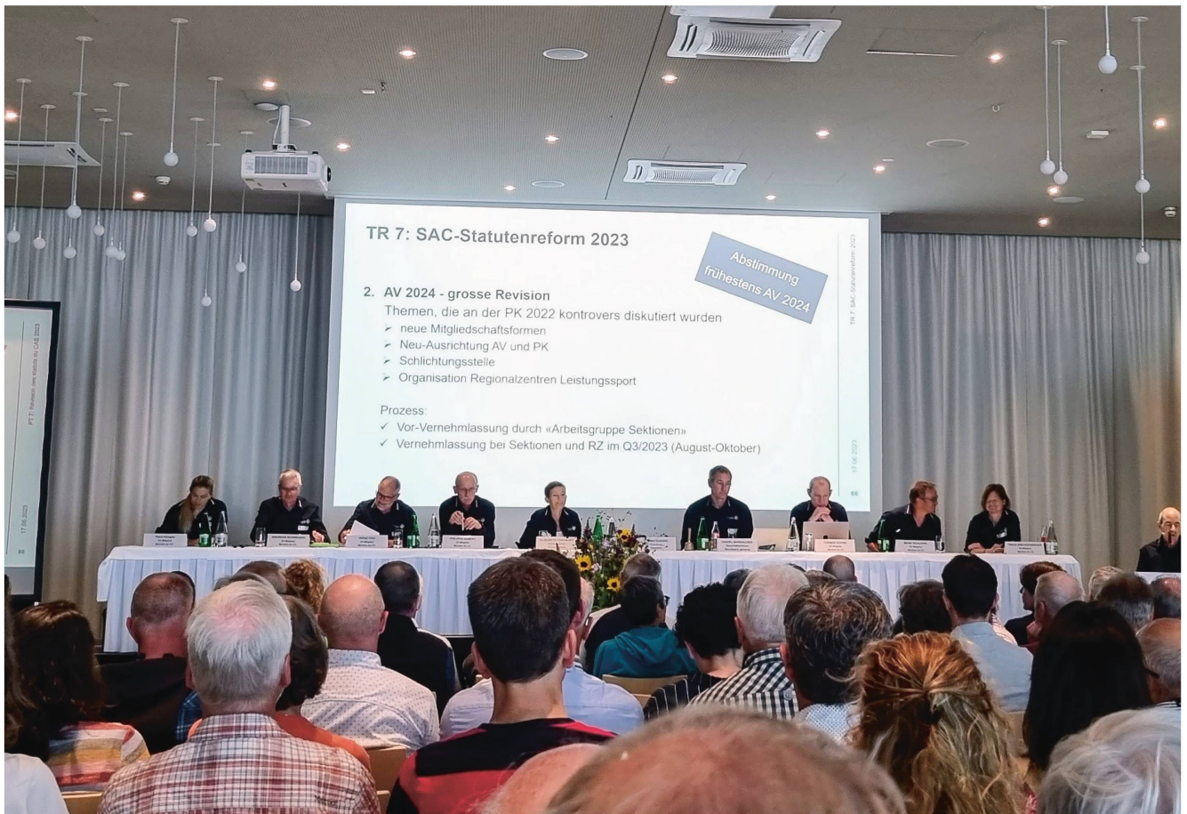
Die AV verlief insgesamt ruhig. Auch eine im Vorfeld umstrittene Wahl findet eine Mehrheit.