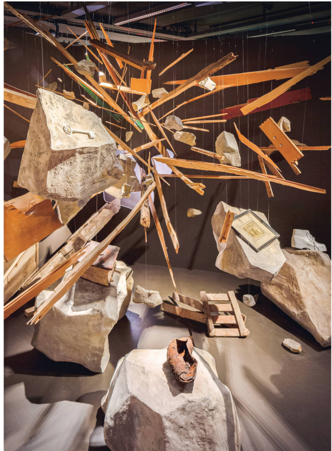
Fast jede Familie besitzt Gegenstände, die an die Explosionskatastrophe von 1947 erinnern.