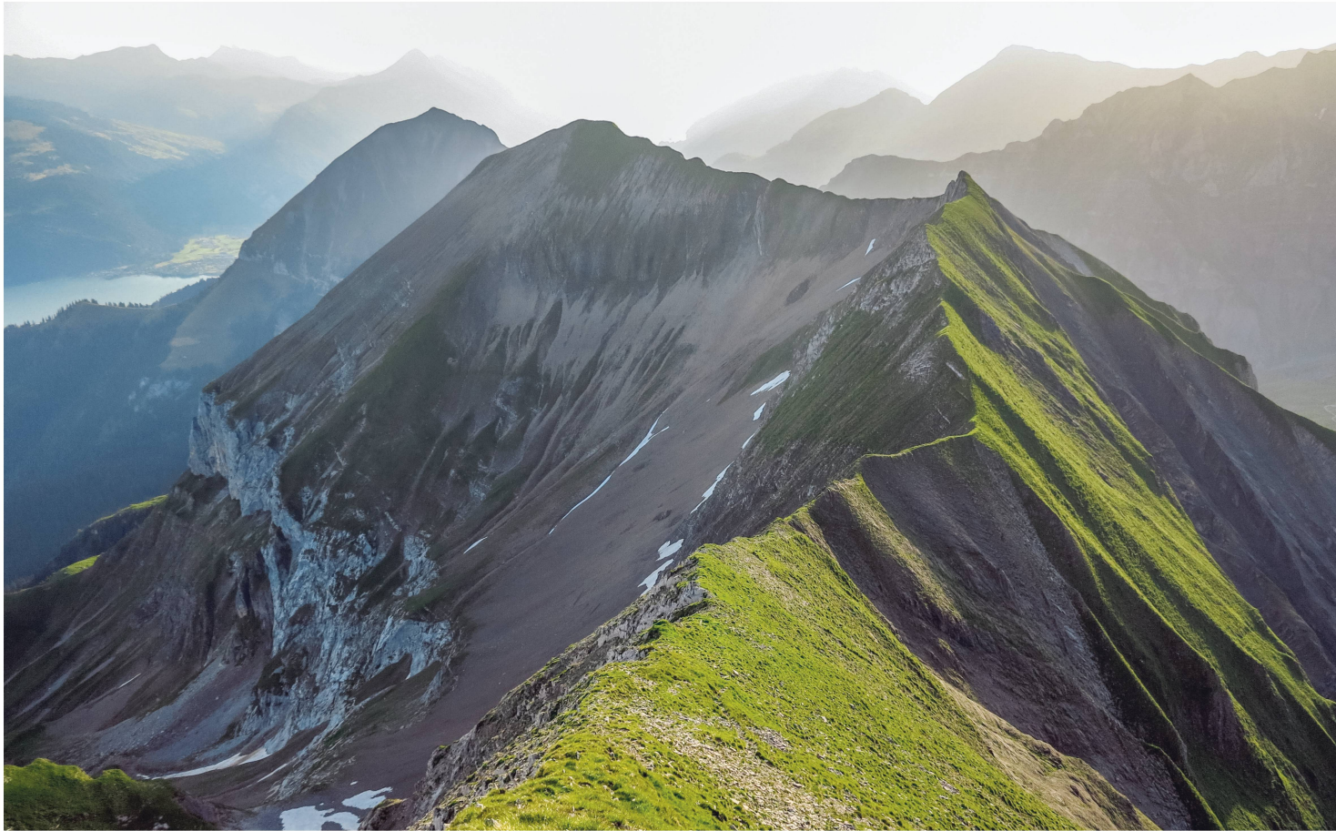
Oberes Suldtal: Blick vom Dreispitz über den Latrejespitz zum First.