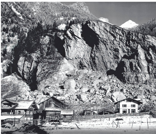
Fluh mit Schuttkegel nach der Explosion.