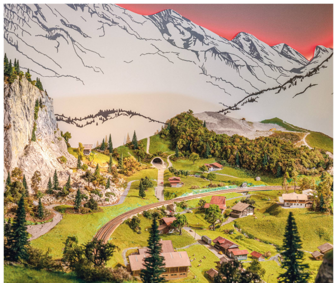
Mitholz-Miniatur am Ausstellungseingang – ein kleines Dorf wirft grosse Fragen auf.