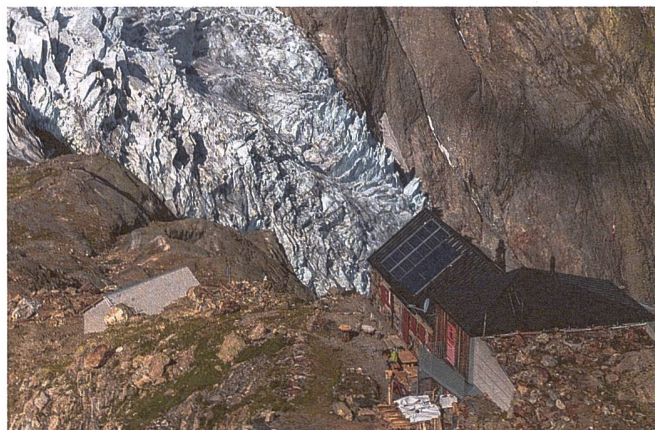
Die Trifthütte, eine unserer drei Haslihütten.

Weitere Informationen findet ihr auf der Homepage, Instagram oder Facebook der Trifthütte.