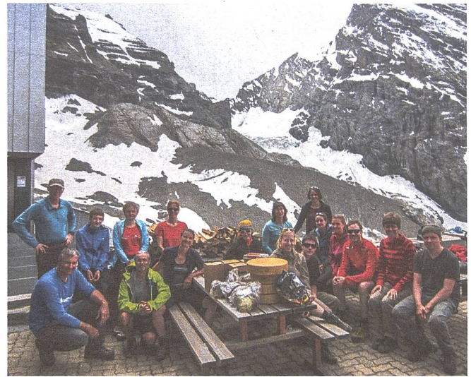
All das haben wir hochgetragen.