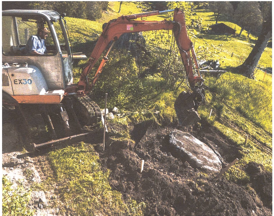
Nachbar Toni beim Baggern.