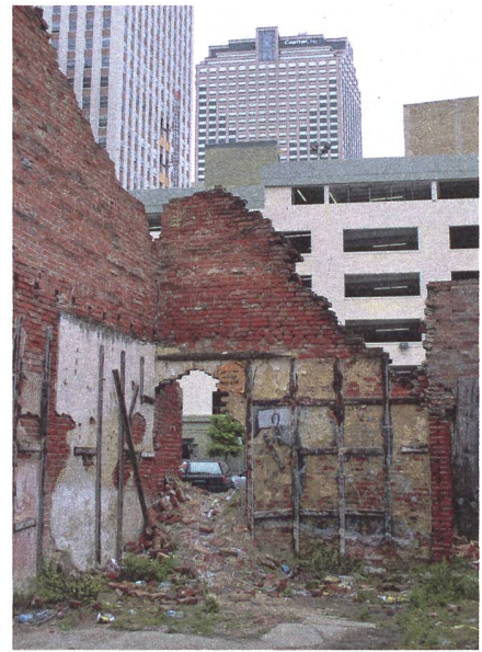
2. Rang: Veronika Meyer, Hinter den Bürotürmen.

Der Fotowettbewerb 2018 zum Thema Zerfall hat wiederum grossen Anklang gefunden. Es wurden 49 Bilder von Fotografen aus der Sektion und nicht nur von der Fotogruppe eingesandt. Die Jurierung haben die Teilnehmer des Fotowettbewerbs durchgeführt und dabei die Bilder mit 1 bis 5 Punkten pro Bild bewertet. Die Bilder sind im Clublokal ausgestellt und können auf der Website der Sektion unter Bilder/Fotogruppe angeschaut werden.