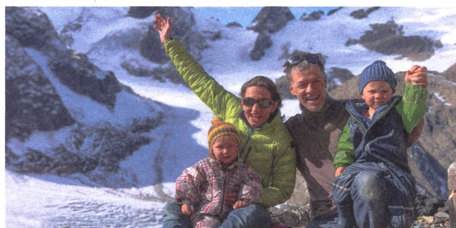
Die Hüttenwartsfamilie freut sich auf die Familienferien.