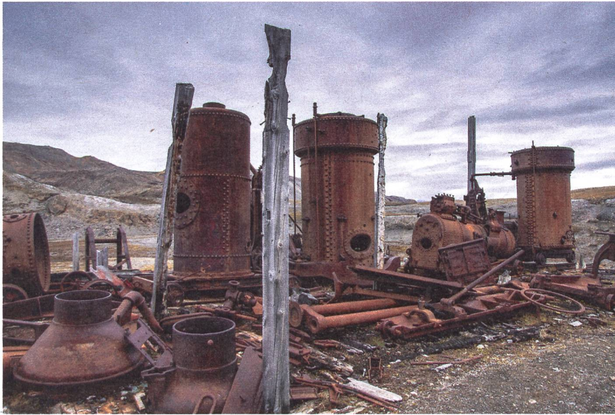
1. Rang: Fred Nydegger, Unter Naturschutz zerfallend.