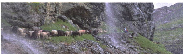
Die Schafe auf dem Weg zur Gspaltenhornhütte taugen nicht als Lastentiere. Aber wir!

Die Umweltkommission macht sich derzeit Gedanken über Projekte, um die Aktivitäten unserer Sektion klimaneutraler zu gestalten oder unsere Emissionen zu kompensieren.