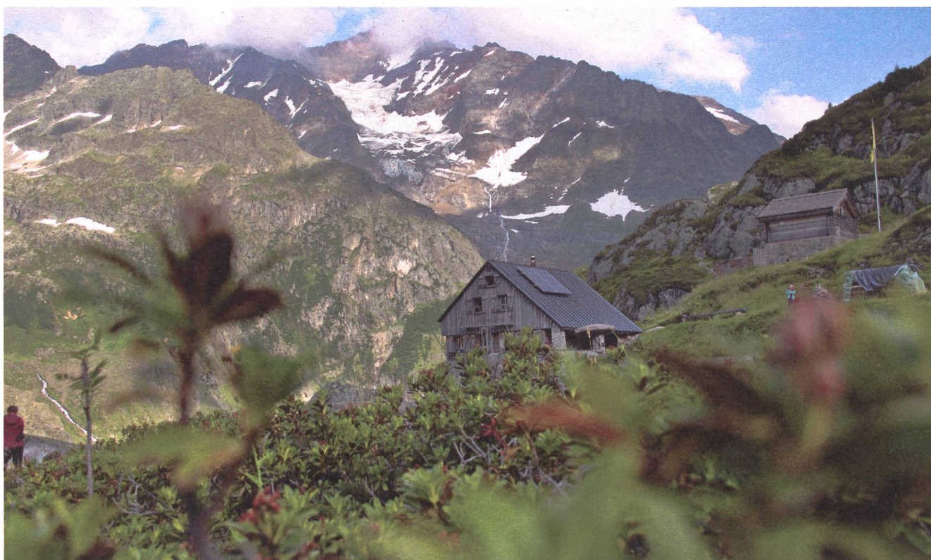
Die familienfreundliche Windegghütte für erholsame Bergferien.