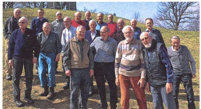
Die Teilnehmer am Gurtenhöck vom 15. April.