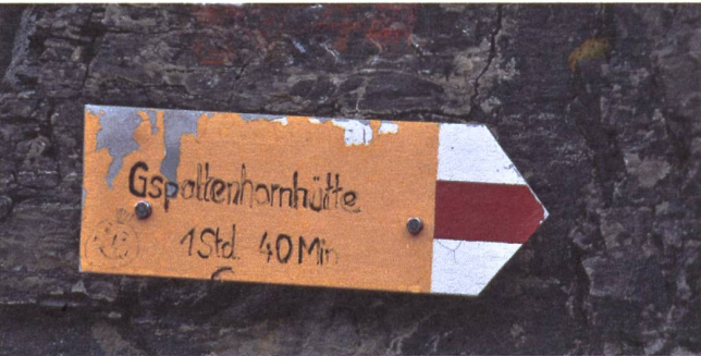
Die vielbesuchte Gspaltenhornhütte braucht mehr Energie.