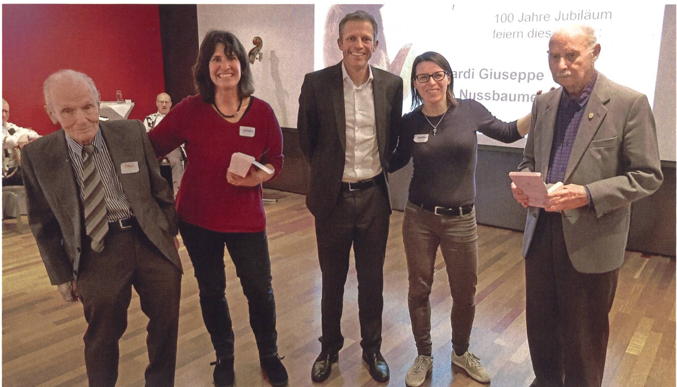
Die beiden 100-Jährigen posieren mit Vorstandsmitgliedern.