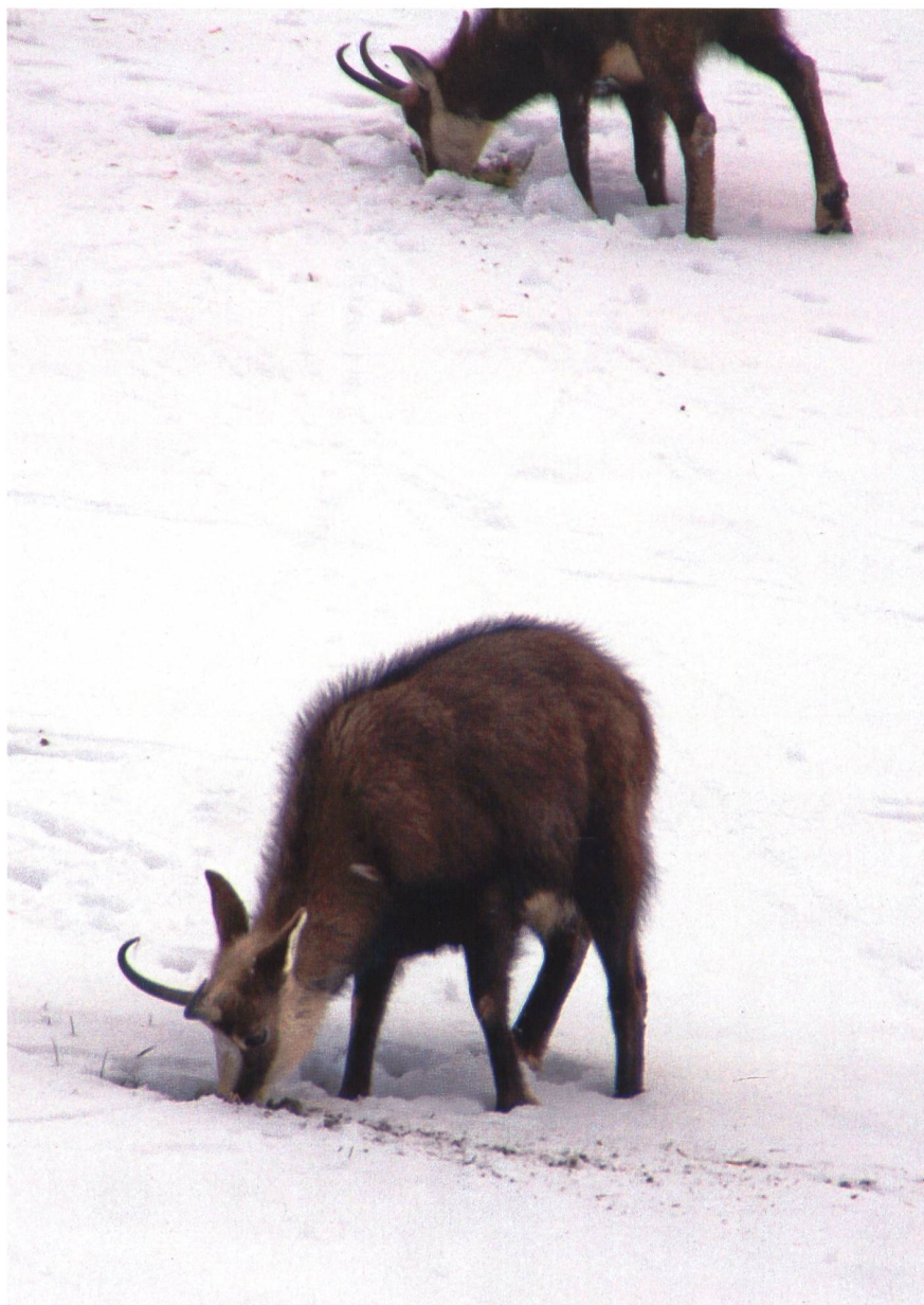
Gämsen scharren sich Futter frei.

Neuschnee nicht wohlfehlte und Richtung Bau kehrtmachte. Zehn Gehminuten vor dem Gipfel der Wasenegg machen auch wir kehrt, da der mittlerweile wieder bedeckte Himmel die Sicht stark getrübt hat und nach der Lawinenprognose in Gratnähe besondere Vorsicht geboten ist. Auf der Abfahrt durchs Schilttal nach Gimmeln profitieren wir vom leichten Neuschnee und sehen, wie die Gämsen auf von Schneerutschen freigelegten Flächen nach Futter suchen.