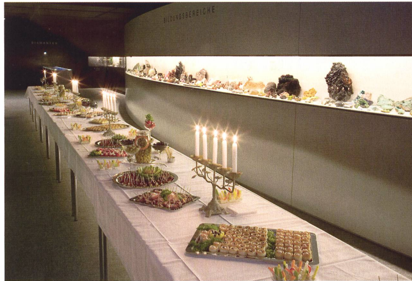
Der Apéro im Anschluss an die HV inmitten von glitzernden Kristallen bietet Gelegenheit für ein entspanntes Schwätzchen.

20.15 Uhr im Anschluss an die Hauptversammlung