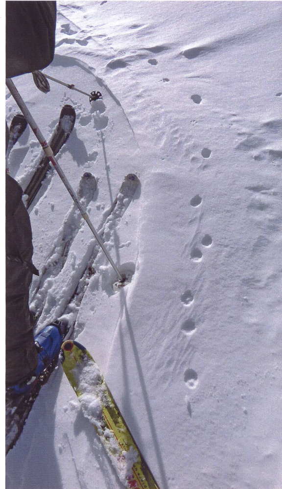
Spuren im Schnee: Welches Tier war hier vor uns unterwegs?