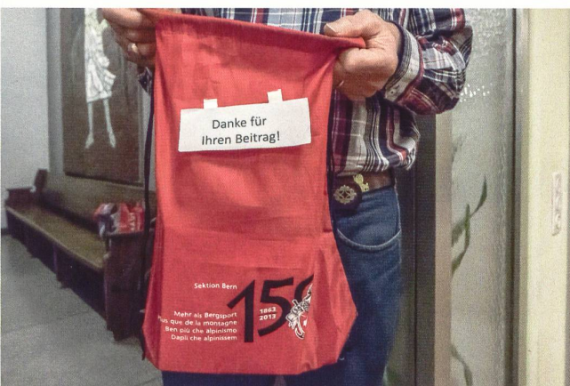
Die Eintritte waren frei. Die Kollekte deckte die Unkosten wie Mieten, Honorare und Werbung bei Weitem.