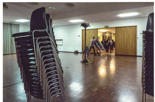
Nachtarbeit nach den Vorstellungen. Die Stühle mussten in abgezählten Türmen für die Abholung zusammengestellt werden.