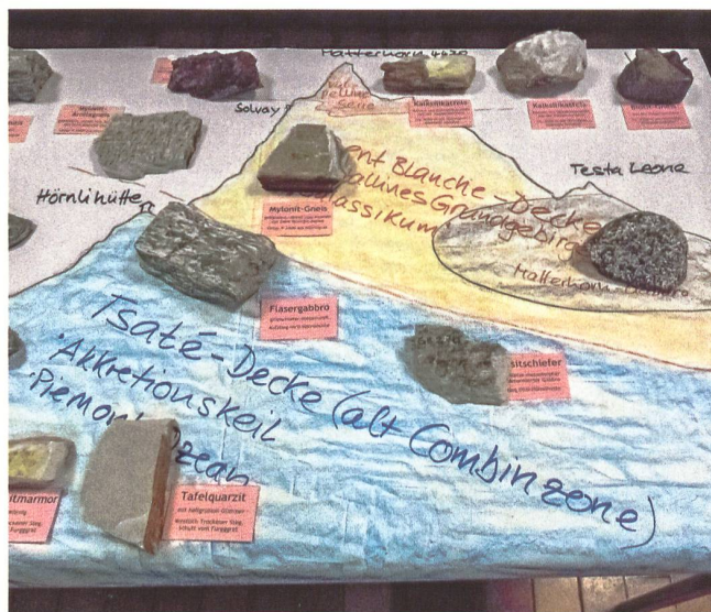
Geologie zum Anfassen im Foyer.