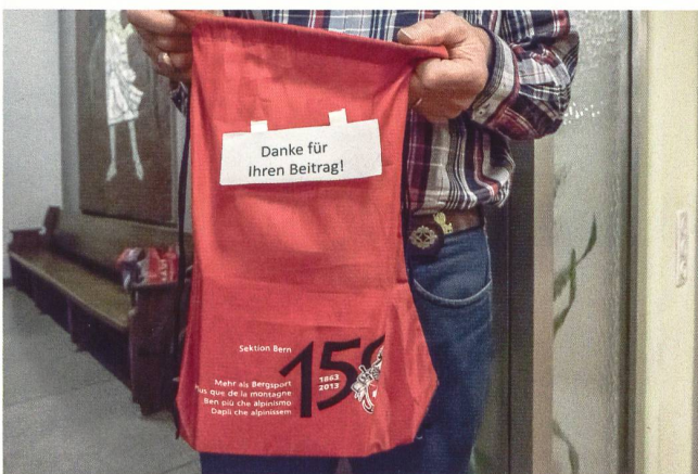
Die Eintritte waren frei. Die Kollekte deckte die Unkosten wie Mieten, Honorare und Werbung bei Weitem.