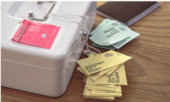
Jeweils rund 60 Personen genossen vor den Vorträgen die feinen Suppen mit Brot und Käse im Restaurant las alps.