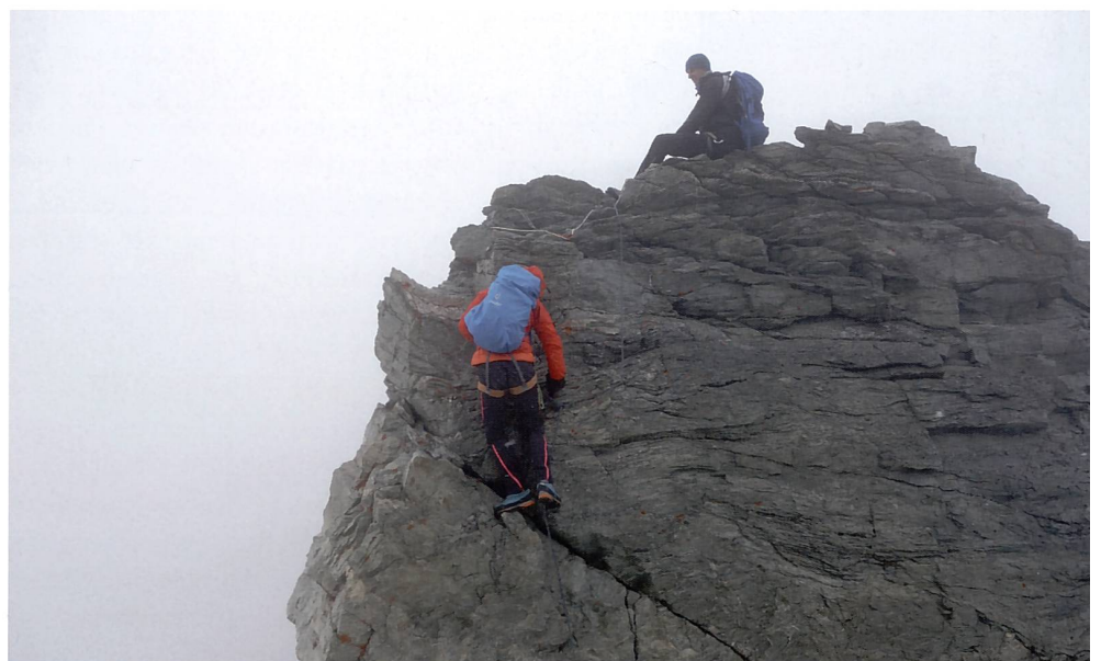
Interessante Kletterstelle am Tschingelhorn.

und Wundklee sowie Thymian für den Tee in der Mutthornhütte, die wir über den erst aperen, dann leicht verschneiten Gletscher erreichen. Nach einer Wohlfühl-pause besuchen wir ohne Gepäck über Geröll und Schneefelder (!) das Grosse Mutthorn, von dem aus wir vom Mont Blanc bis zum Monte Leone alle Gipfel erkennen können. Die angekündigte Wetteränderung zeigte sich im Westen an grauem, wildem Gewölk.