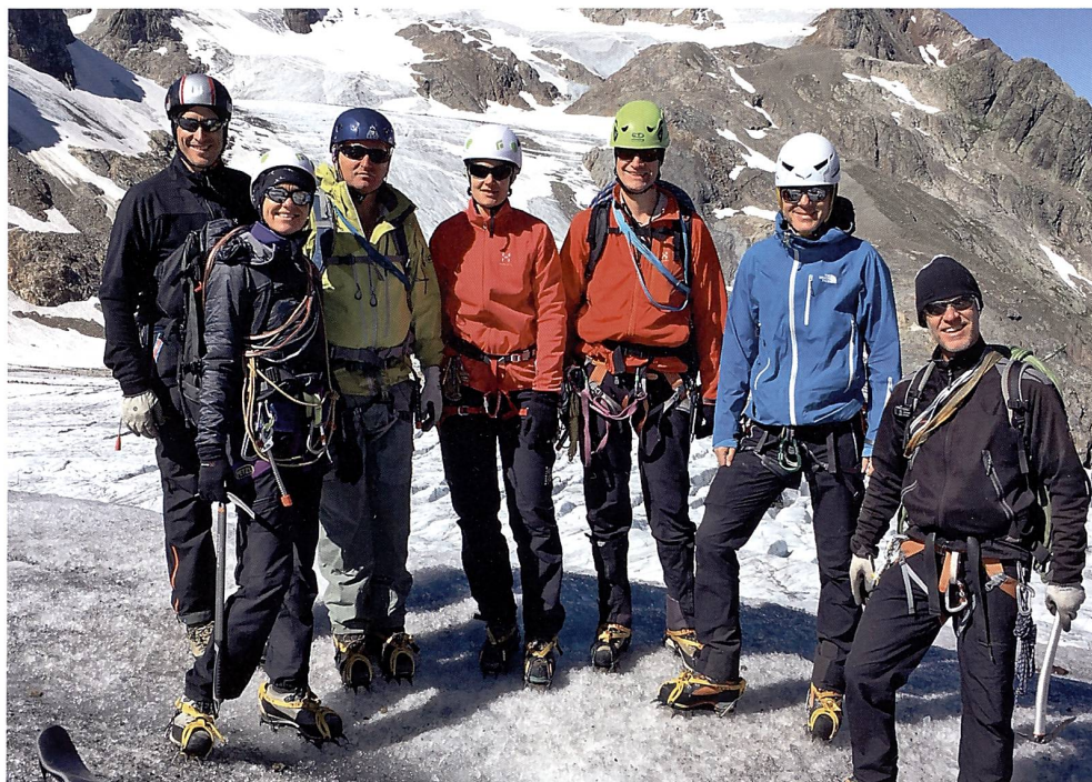
Die Gruppe festigte ihre Hochtourenkenntnisse im Triftkessel.

Zurück bei der Hütte muss das Aussengeländer zum oberen Stock erhalten als Übungsstrecke für den frei hängenden Selbstaufstieg, und in Zweiergruppen üben wir nochmals selbstständig den Österreicher – sowohl in der Theorie wie auch in der Praxis.