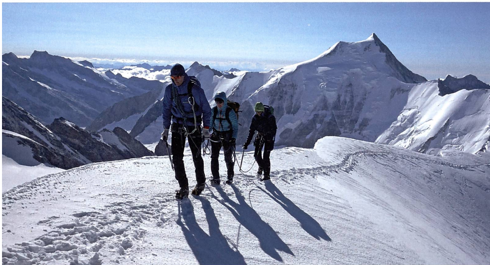
Die dritte Seilschaft erreicht den Gipfel des Mittaghorns (3892 m).

wo wir die Bachseite wechselnd weiter über einen felsigen Längsrücken unter dem Anenhüttenfelsen in coupiertem Gelände entlang Pfützen, Bächen und geschliffenen Felsen weiter hoch bis zu einem riesigen Gletschertor mit einer grossen Kieschwemmebene ansteigen. Kurz später auf dem Gletscher staunen wir über Gletschertische, mit Sand überzuckerte Eispyramiden, in denen wir fünfzigjährige, grosse Eiskristalle finden. Weiter über Gletschereis, Fels, wenig Neuschnee zur Lötschenlücke, von wo wir über den Klettersteig zur Hollandiahütte gelangten. – Beim Blick zurück staunten wir über die Vielfaltigkeit der durchschrittenen «Landschaften», obwohl wir stets im gleichen Tal sieben Stunden aufgestiegen waren.