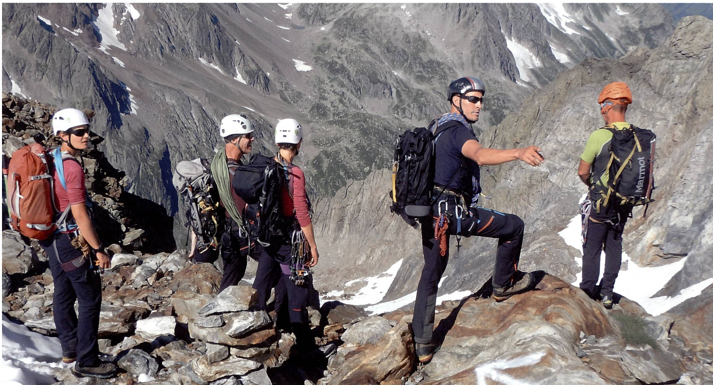
Wo bitte gehts zur Abseilstelle?

Ausbildungswoche Hochtouren II vom 22. bis 26. August 2016.