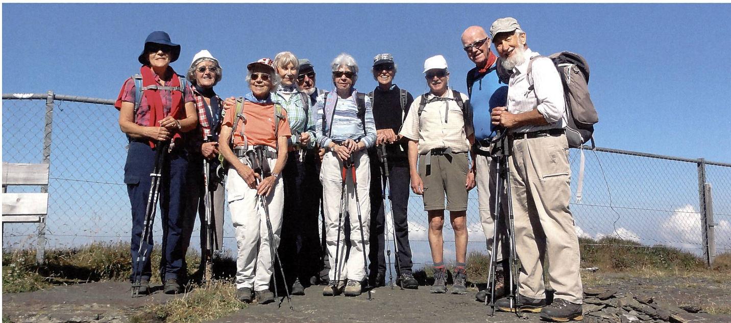
Das Trüppchen zeigt flexiblen Einsatz – was sich gelohnt hat.

Bergwanderung über das Lauberhorn vom 14. September 2016.