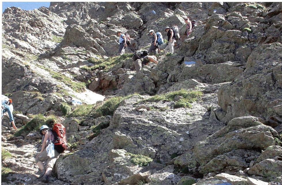
Kraxlerei beim Aufstieg.

Als wir die Hütte erreichen (2663 m) sind wir alle stolz, diesen Aufstieg mit den doch anspruchsvollen, ausgesetzten und langen Passagen bewältigt zu haben. So geniessen wir die feine Bewirtung der Hüttenwartin