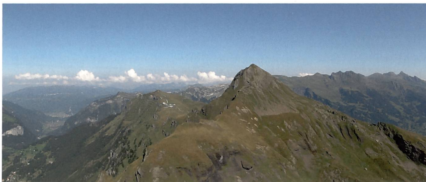
Die föhnige Herbstluft lässt weit sehen.

Um die Knie etwas zu schonen, liessen wir uns in den roten Kabinchen der Männlichenbahn bis zur Mittelstation befördern.