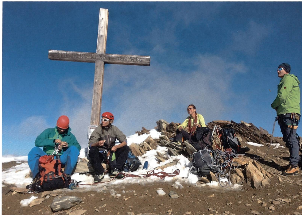
Zvieri auf dem Gipfel.

Aufschwünge wechseln sich nun ab mit Gehgelände, und irgendwann folgt ein Felsband, welches in die Nordostflanke führt. Weg ist die Sonne und es zieht ein