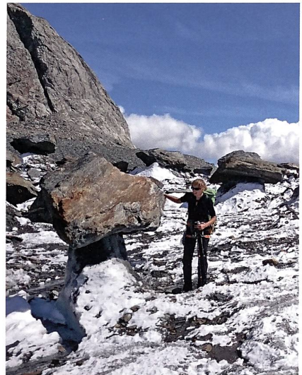
Einer der eindrücklichen Gletschertische unterhalb der Konkordiahütte.

Für unsere Königsetappe aufs Grosse Fiescherhorn versprach der Wetterbericht einen stahlblauen Himmel. Diesen sahen wir allerdings erst im späteren Abstieg auf dem Fieschergletscher. Der ganze Aufstieg zum Fieschersattel, bei dem Jürg seine Kartenlesekunst und seinen Spürsinn einsetzte, war eine Expedition durch Nebel und einen Spaltenwirrwarr. Zuletzt über eine verschneite Felsrippe nach «Patagonien» mit in den Himmel ragenden Gneisstürmen, die mit bis zu 10 cm langen Eiskristallen besetzt waren. Den Gipfel liessen wir unbestiegen. Erst im Blindabstieg durch 20–30 cm nassen Schnee, später an einer Stelle mit richtigem Styroporkügelchen-Schnee kam dann Sicht, die uns auf dieser Seite des Fieschersattels half, zwischen den Spalten den Weg zu finden. So wurde dann die Vorstellung wahr, auf der Sonnenterrasse der Finsteraarhütte das Panaché geniessen zu können.