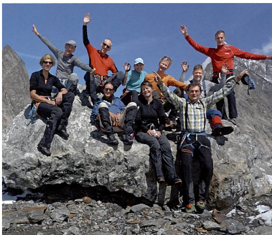
Gruppenbild auf dem Konkordiaplatz.

Mit Nebel und Graupel begann der Tag vor der Türe. Der Kompass half Lorenz durch die Spaltenzone hoch auf die Fläche, wo die Wolken wegflogen mit eisigem Wind