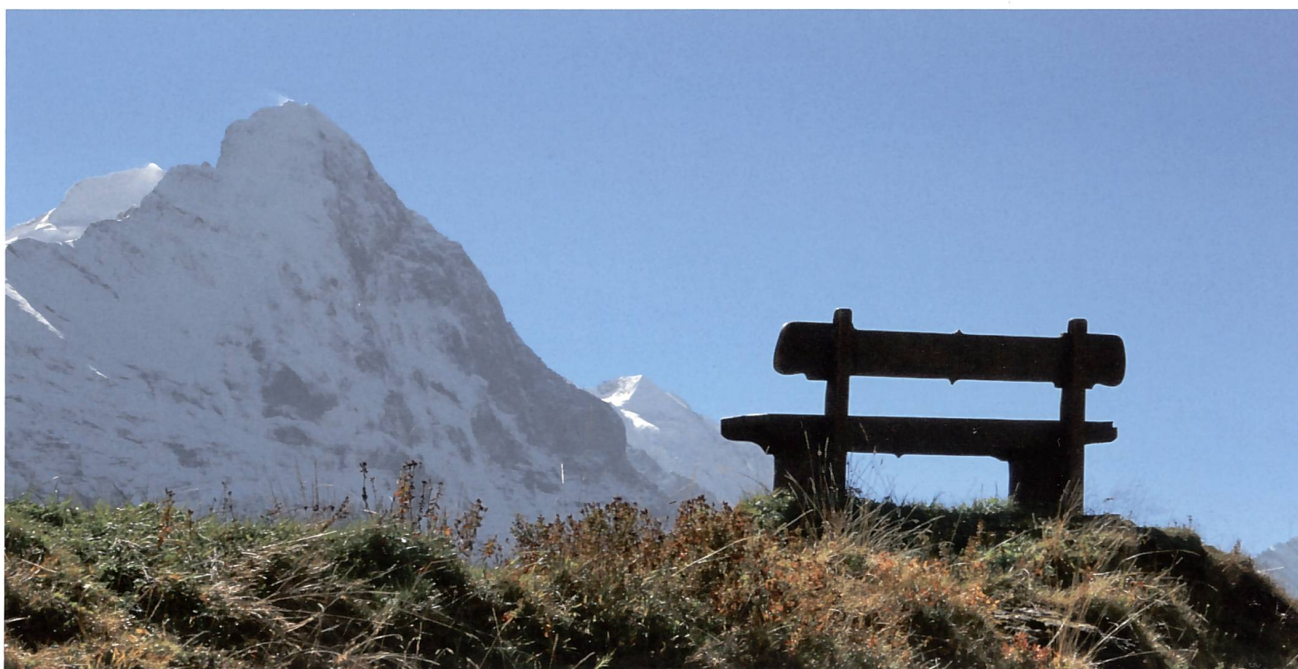
Und im Vordergrund ein Bänkli...