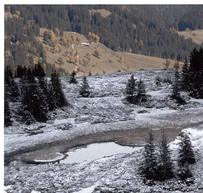
Kalt, warm – Schatten, Sonne.