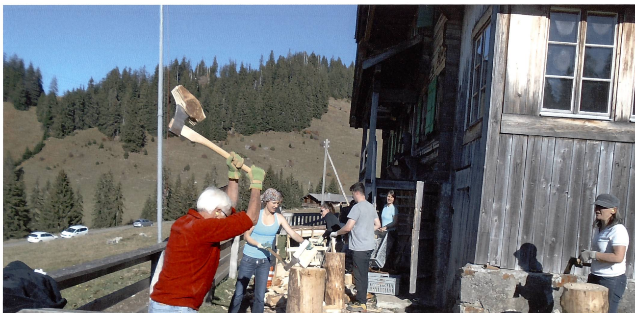
Holz macht dreimal warm. Hier der erste Teil...