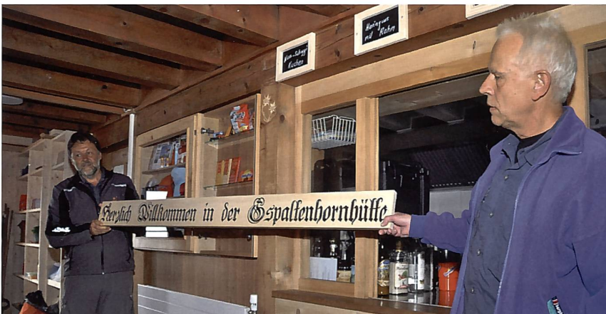
Baumeister und Architekt spendieren den neuen Willkommensgruss.

Die beiden Schlafsäle mit 15 und 34 Betten gehören der Vergangenheit an. Auf zwei Stockwerken sind nun 63 Schlafplätze in hellen Schlafräumen mit Dreier-, Vierer-, Achter- und sogar in vier Zweierkojen aufgeteilt. Daunenduvets und weiche Kissen ersetzen die kratzenden Wolldecken. Der massive Tannenholzboden und die