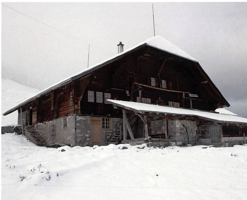
Die Rinderalphütte steht von Ende Oktober bis Ende April zur Verfügung.

In der Zwischensaison, bevor der erste Schnee auf 1700 Metern fällt oder wenn der Bergschnee bereits geschmolzen ist, bieten sich lange Wanderungen im Diemtigtal an. Die Strecken sind ebenfalls fürs Biken wie geschaffen. Die Königsdisziplin der Rindere ist aber natürlich der Klettersport. Hier ist für fortgeschrittene Kletterer die steil abfallende Südseite des Abendberges sehr zu empfehlen. Zuerst muss von oben ca. 70 Meter abgeseilt werden, um dann den Zustieg in 2–4 Seillängen wieder zu schaffen. Ein Zustieg zum Wandfuss bzw. ein Abstieg ist nur im Notfall zu empfehlen. Die Schwierigkeit der Routen bewegt sich hier zwischen 6a und 7b und wartet jeweils mit sehr griffigem Fels in perfektem Ambiente auf. Für Gruppen oder für etwas weniger Fortgeschrittene empfiehlt sich der kleine Klettergarten am Fusse des Turnen. Von der Rindere kann der Zustieg in ca. 40 Minuten bewältigt werden. Die Routen sind kurz und gut abgesichert und bieten auch