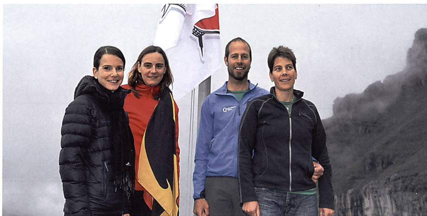
Die Präsidentin, die Hüttenchefin und das Hüttenwartepaar frieren unter der neuen SAC-Fahne.

letzte Nacht zersägt?» fragt mich mein übernächster Bettnachbar. Auch in der neuen Hütte ist man vor den altbekannten Störfaktoren nicht gefeit.