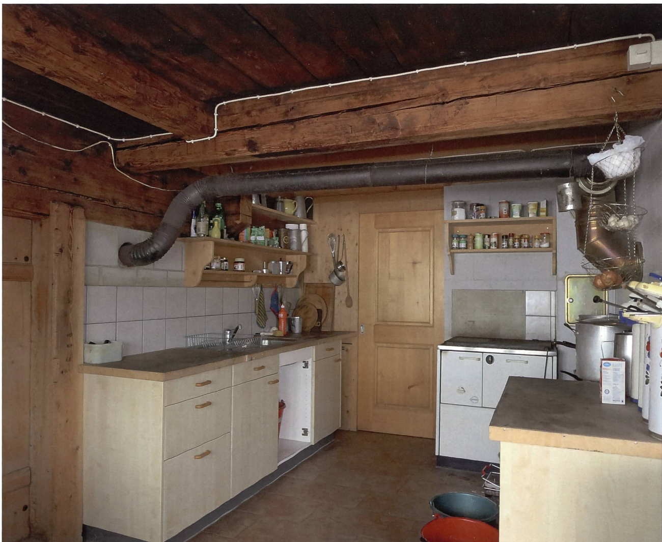
In dieser Küche kann man mehr als nur Spaghetti zubereiten.