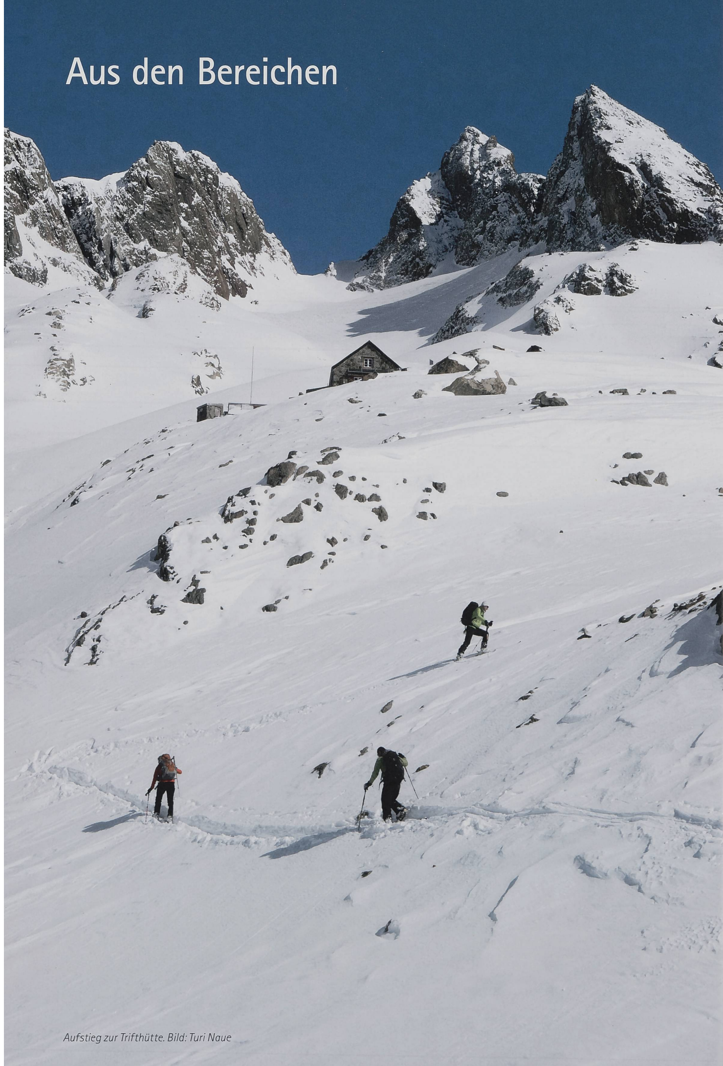
Aufstieg zur Trifthütte.