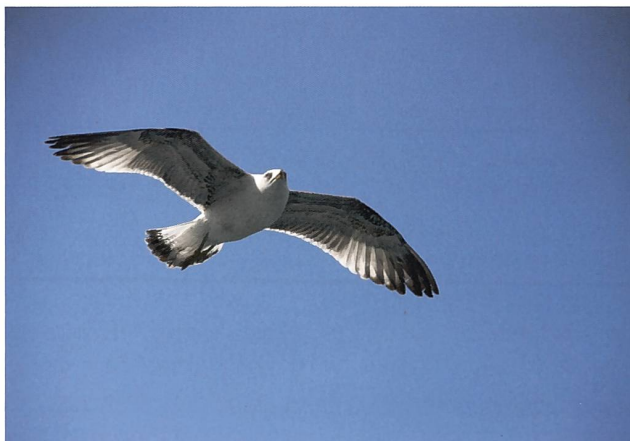
2. Rang: Therese Mejstrik, Nichts ist schöner als fliegen.