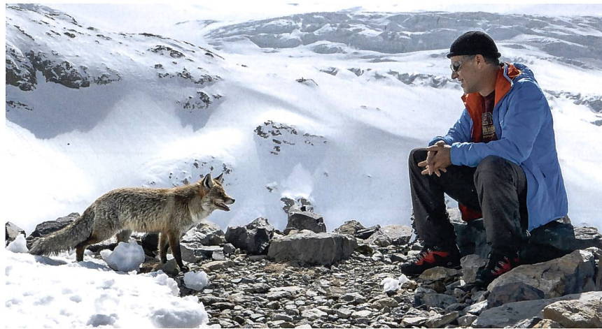
Der Hüttenfuchs und der, der es auch werden will.