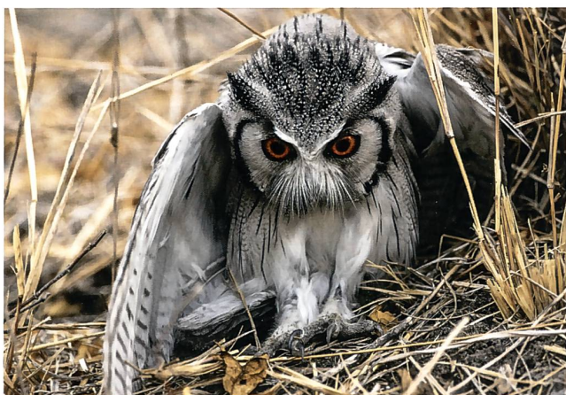
2. Rang: Fred Nydegger, Auf der Jagd.

Die Fotogruppe schreibt jedes Jahr einen Fotowettbewerb aus. Alle interessierten Sektionsmitglieder können daran teilnehmen. Das Thema 2015 lautet Am Wegrand . Abgabetermin ist der 17. November 2015. Die Teilnahmebedingungen sind auf unserer SAC-Website unter Interessengruppen/Fotogruppe ersichtlich. Hier sind auch die Bilder früherer Wettbewerbe aufgeschaltet.