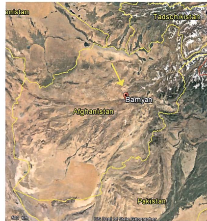
Bamiyangebiet im Norden Afghanistans in einem südlichen Ausläufer des Hindukuschgebirges.