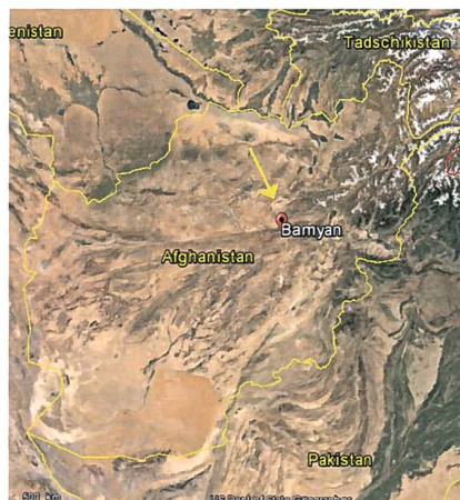
Bamiyangebiet im Norden Afghanistans in einem südlichen Ausläufer des Hindukushgebirges.