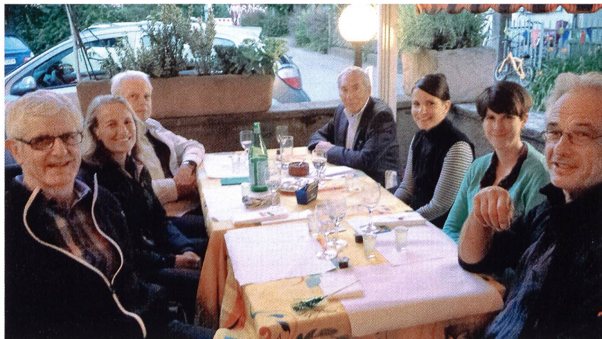
Die Vorstandsvertretungen von SAC – Bern und AACB beim jährlichen Treffen im «Römer» Bern.