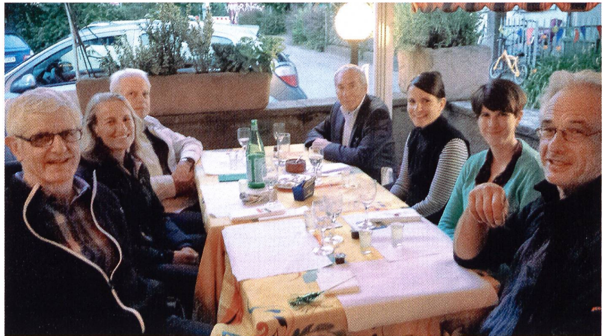
Die Vorstandsvertretungen von SAC – Bern und AACB beim jährlichen Treffen im «Römer» Bern.