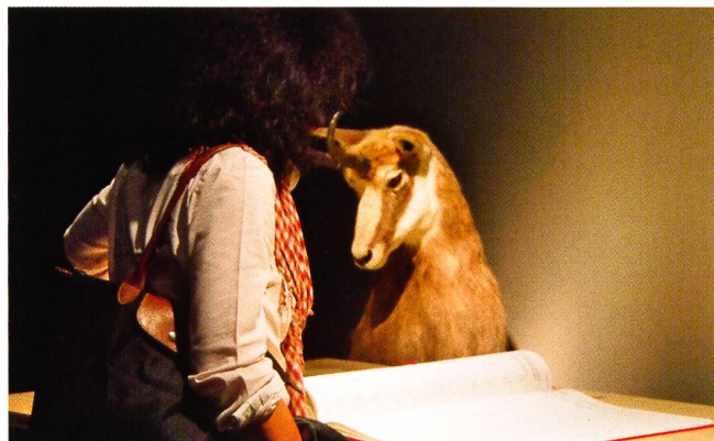
Die Gäste genossen eine kurze Führung durch die aktuelle Ausstellung Helvetia Club. Auch unser Wappentier zeigt sich höchst interessiert an unserem Besuch.