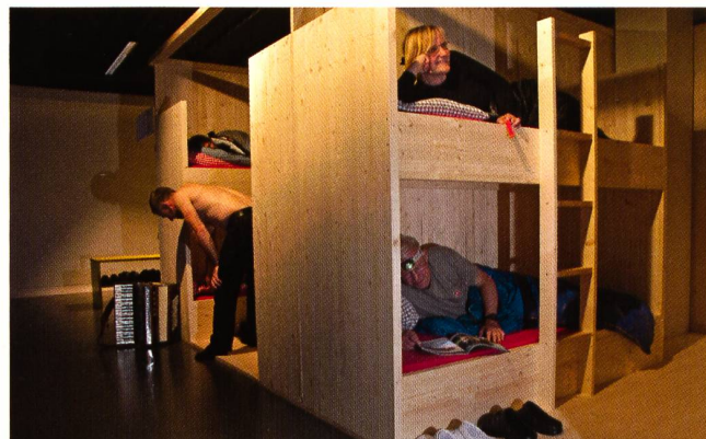
Dem Vorstand gebührt die Ehre, die neuen Betten der Gspaltenhornhütte einzuschlafen.