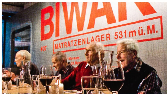
Rund 50 interessierte Gäste nahmen an der Vernissage der Ausstellung Biwak #07 und Eröffnung der 153. temporären SAC-Hütte im alps teil.