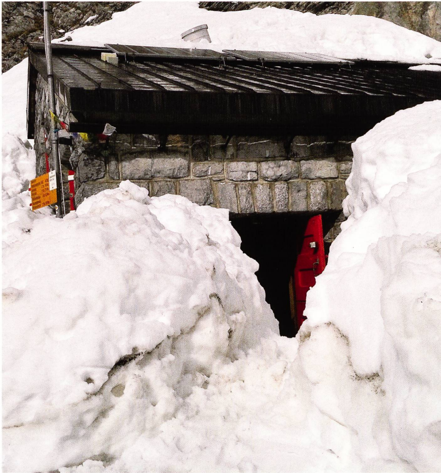
Viel Schnee prägte den Start ins Hüttenjahr 2013.

Das Jubiläumsjahr neigt sich dem Ende zu. Ebenso unser erstes Jahr als Hüttenwarte in der Gspaltenhornhütte. Der lange und schneereiche Winter 2013 hat auch in unserer Hütte Spuren hinterlassen. Der ganze Juni war geprägt von Schnee schaufeln, Schnee schaufeln und nochmals Schnee schaufeln. Die Vorbereitungsarbeiten haben sich aber gelohnt. Wurden wir doch mit einem fast gewitterfreien Juli und mit einem schönen und warmen August belohnt. Der September war dann ziemlich durchzogen. Einmal Schnee bis zur Hütte und dann wiederum herrliche Herbsttage. Unsere erste Saison als Hüttenwarte ist zu unserer vollen Zufriedenheit verlaufen. Wir sind mit 89 Bewar-tungstagen ein paar Tage unter dem gewünschten Durchschnitt. Jedoch haben wir unser Ziel von 2000 Über-nachtungsgästen erreichen können.