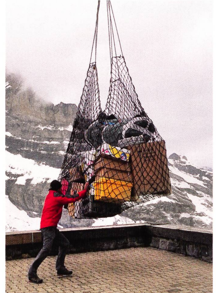
Eine Herausforderung, die Planung der Versorgungsflüge.