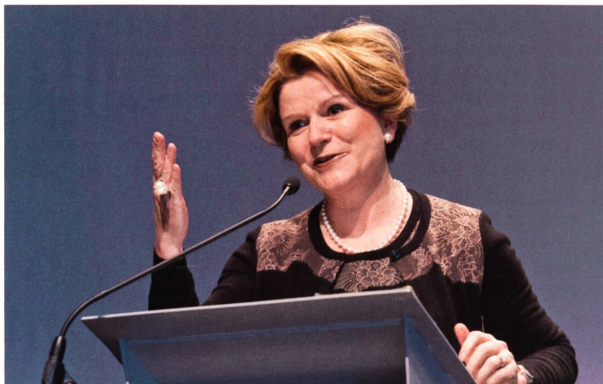
Frau Staatssekretärin Ineichen-Fleisch als Rednerin an der Snownetveranstaltung.

für Wirtschaft (SECO). Die Verknüpfung einer solchen Kaderposition mit der zeitintensiven Passion für den Alpinismus ist kein leichtes Unterfangen. Die Chefin des SECO, welche in ihrer Funktion auch für die Tourismuspolitik des Bundes verantwortlich ist, zieht für uns Parallelen zwischen ihrer Arbeit und dem Bergsteigen und wagt einen Ausblick auf die Herausforderungen und Chancen des Bergtourismus in der Schweiz.