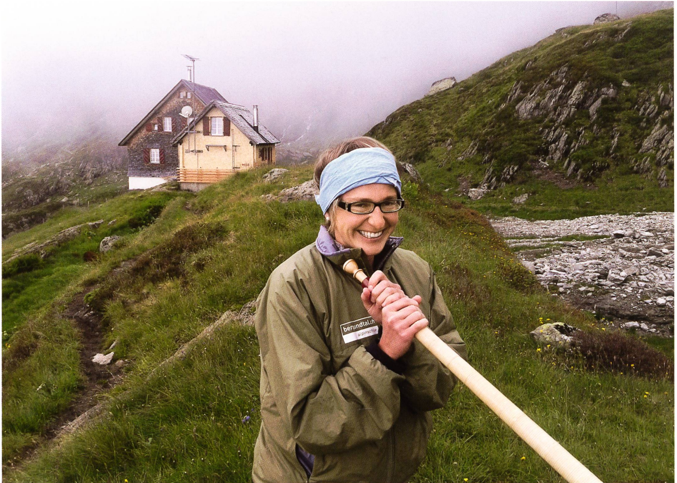
Die Hütte und ihre Wartin.