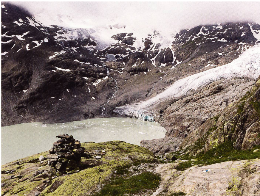
Gauli – Bergwelt pur.