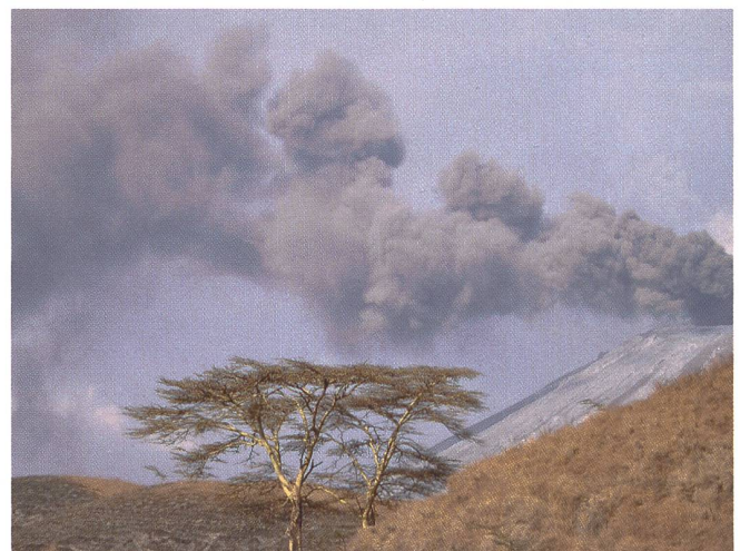
Ausbruch des Oldoinyo Lengai