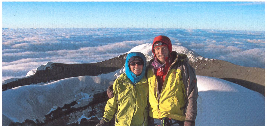
Gipfelfoto am Cotopaxi

Landschaften auf Wanderungen oder Trekkings durchquert und die Gipfel bestiegen. Stromboli, der Aetna und die Vulkankrater der Ägäis faszinieren ebenso wie der Cotopaxi in Ecuador, die Vulkane Hawaiis und Neuseelands, der Kilimandscharo in Tanzania oder der Oldoinyo Lengai im Land der Masai. Das nötige Training dazu bauten wir uns jeweils auf Gebirgstrekkings und Besteigungen in den Schweizer Alpen auf.