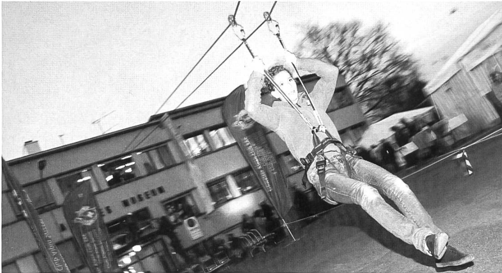
Saubere Landung – Stilnote gut.

36 m und einer Neigung von 10 Grad aus dem 2. Obergeschoss des SAM auf den Helvetiaplatz. Der Start erfolgte aus einem Fenster, etwa 8 m über Boden, und konnte via Hotelrezeption und Podest erreicht werden. Bereits am Donnerstagnachmittag konnten wir mit dem Aufbau im Innern anfangen und von Freitagmorgen bis in den mittleren Nachmittag wurde die Tyrolienne betriebsbereit erstellt.