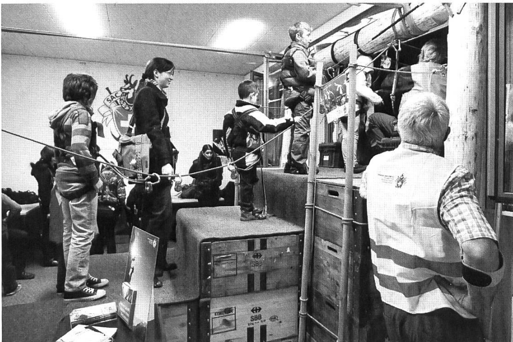
Andrang auf dem Startpodest.

Die ersten Berechnungen und Sicherheitsabklärungen zeigten bald einmal auf, dass eine professionelle Unterstützung für den technischen Teil und ein massiver personeller Einsatz für den Betrieb notwendig würden. So begann das Projekt allmählich Gestalt anzunehmen. Die Tyrolienne führte über eine Länge von