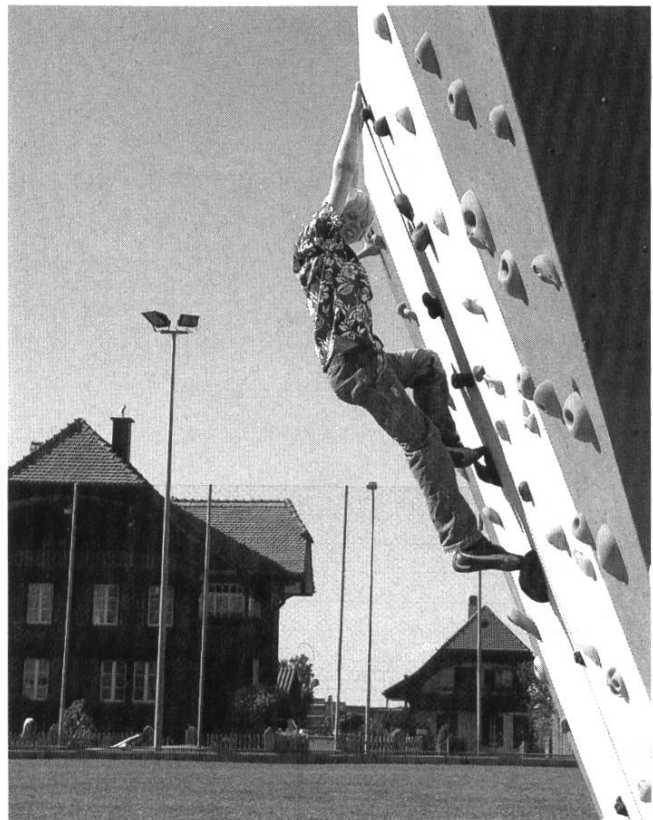
Klettern am Boulderwürfel kostet Kraft.

Weitere Informationen und Bilder zum Boulderwürfel gibts auf der Website: