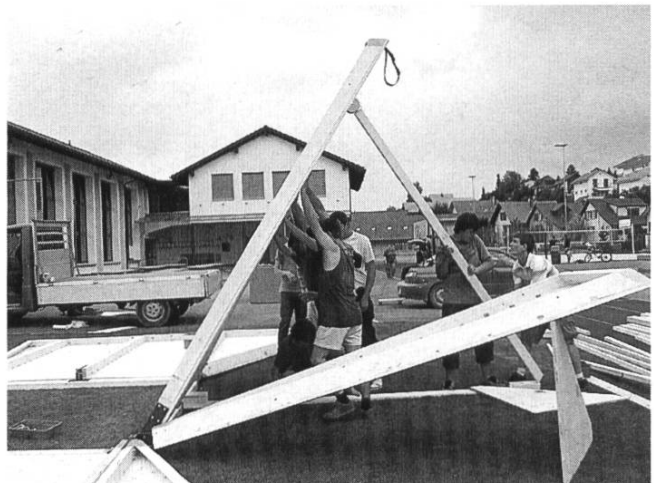
Aufbau des Boulderwürfels.