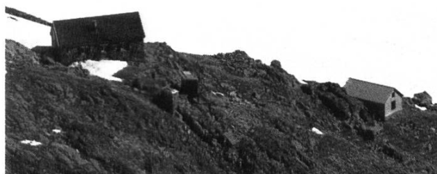
Alte und neue Trifthütte