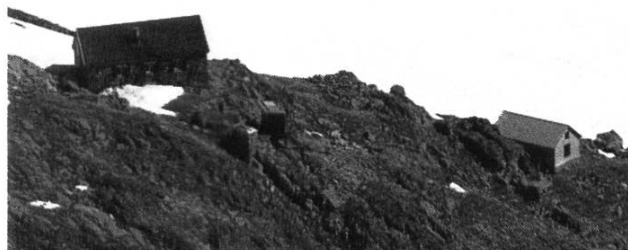
Alte und neue Trifthütte

Der Standort der Trifthütten liegt in der Gemeinde Gadmen zwischen Susten- und Grimselpass auf 2520 m über Meer. Am 19. April 1906 hat der Berner Fabrikant Gustav Hasler der SAC-Sektion Bern die damals neue Trifthütte geschenkt. Diese Hütte wurde nach den Plänen der Berglihütte vom selben Zimmermeister in Grindelwald gebaut und an ihren Standort transportiert, wo sie die damals alte Hütte von 1867 ergänzte. 1947 baute man oberhalb des bestehenden Standortes eine weitere Hütte. Diese in massivem Bruchsteinmauerwerk erstellte Hütte war denn auch der letzte Neubau. Sie wird heute als «neue Trifthütte» bezeichnet und ist in der Skitourensaison und im Sommer bewartet. Ergänzt wird sie mit der als «alte Trifthütte» bezeichneten und 1906 als Holzbau, ehemals mit Holzschindeldach und -fassade, erbauten Unterkunft. Die älteste und kleinste Hütte besteht hingegen nicht mehr.