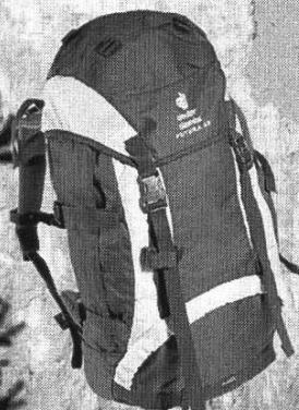
DEUTER Aircomfort Futura sportlicher Allrounder 42 Liter Fr. 199.-

-Vielseitig und komplett ausgestattete Gebirgsjacke Grössen: S-XL Fr. 519.-