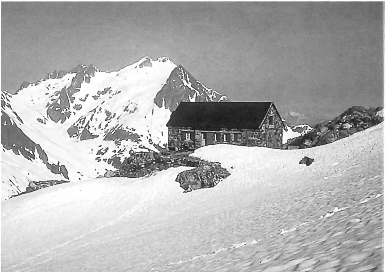
Trifthütte, 2525 m, mit Furtwangsattel und Mährenhorn