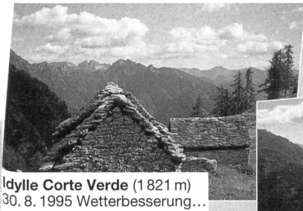
Idylle Corte Verde (1821 m) 30. 8. 1995 Wetterbesserung...

Einkehr des Winters auch im Süden (29. 8. 1995)