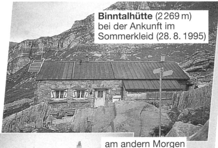
Binntalhütte (2269 m) bei der Ankunft im Sommerkleid (28. 8. 1995)