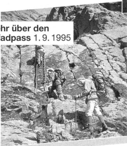
Heimkehr über den Geisspfadpass 1. 9. 1995

Grüne Landschaft in tieferen Lagen (31. 8. 1995)