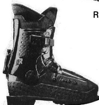
Raichle Nanga Parbat