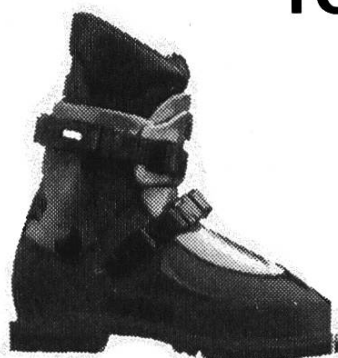
Koflach Valluga 4000