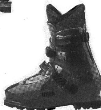
Lowa Super Peak

beim Sportzentrum 3825 Mürren Tel. 036 55 23 55