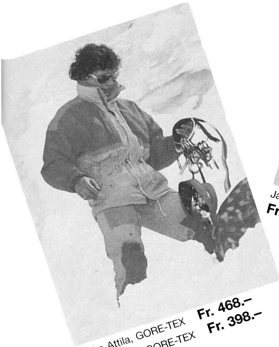
Jacke Attila, GORE-TEX Fr. 468.- Hose Jupiter, GORE-TEX Fr. 398.-