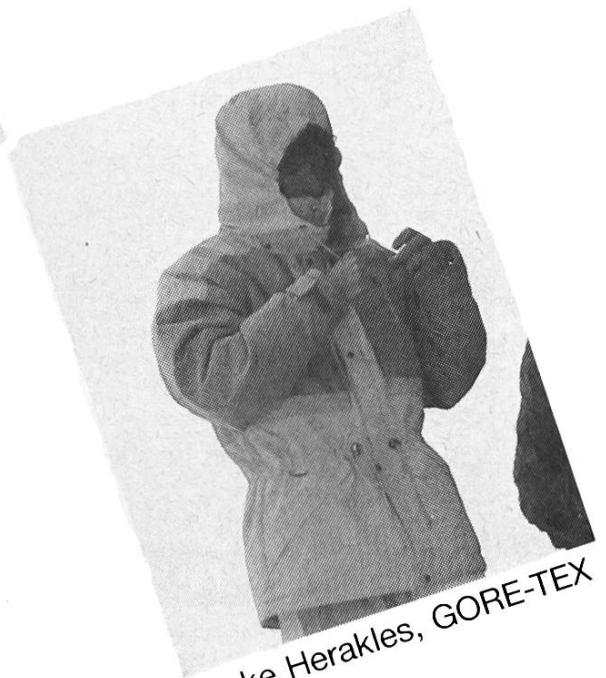
Jacke Herakles, GORE-TEX Fr. 554.-