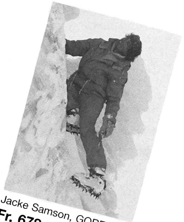
Jacke Samson, GORE-TEX Fr. 678.-