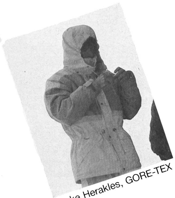
Jacke Herakles, GORE-TEX Fr. 554.-