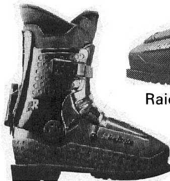
Raichle Nanga Parbat