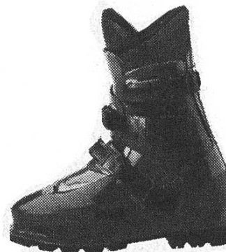
Lowa Super Peak