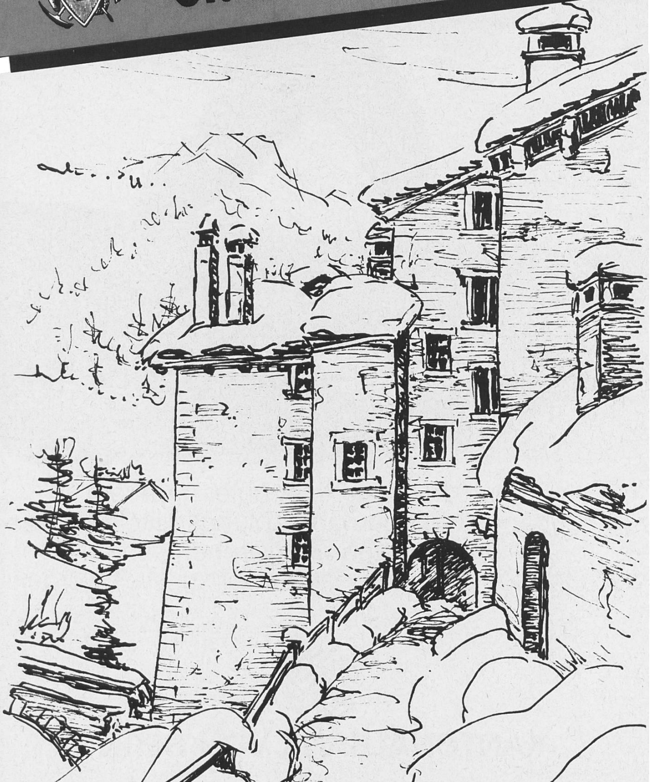
von-Schorsch-Haus in Splügen