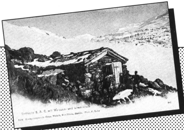
Trifflhütte S. A. C. mit Weiss- und Gletscher 8416 Hochgletscher, Gletscher, Weiss, Gletscher, Gletscher.