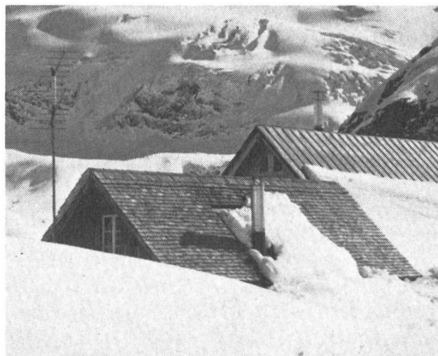
Gaulihütte, 2205 m

Wem ist dieser Slogan nicht geläufig? Wer eine Neuigkeit weitergeben oder sonst Wichtiges anbringen will, bedient sich des zur Selbstverständlichkeit gewordenen Kommunikationsmittels, dem Telefon. Diese Einrichtung hat dank der drahtlosen Über-