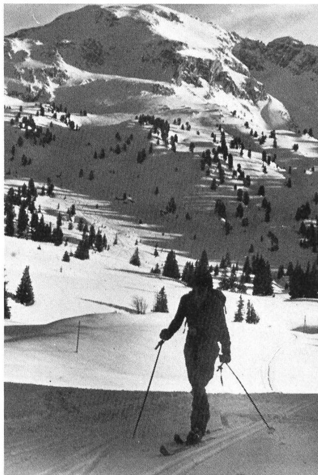
Seehorn, 2281 m

schlächt gsy. So hei mir halt ou dr erscht Teil vor Tour, vo Männiggrund bis zum «erschte Schnee», z'Fuess müesse zrügglege. Bevor's mit de Fähli wyterggange isch, het üs dr Dänu mit em Lawinesuechgrät bekannt gmacht. Klari Sach, dass jede Teilnähmer dr ganz Tag es Grät uf sich treit het. So isch es also de ändlich richtig losgange, mir sy loszottlet amene wunderbare Wintermorge, d'Sunne het vomene stahlblaue Himmel obe abe glachet. Das het sich natürlich uf üs alli übertreit, und mir hei alli beschti Luune gha. Düre Wald uf sy mir ufenes wyts Hochpla-