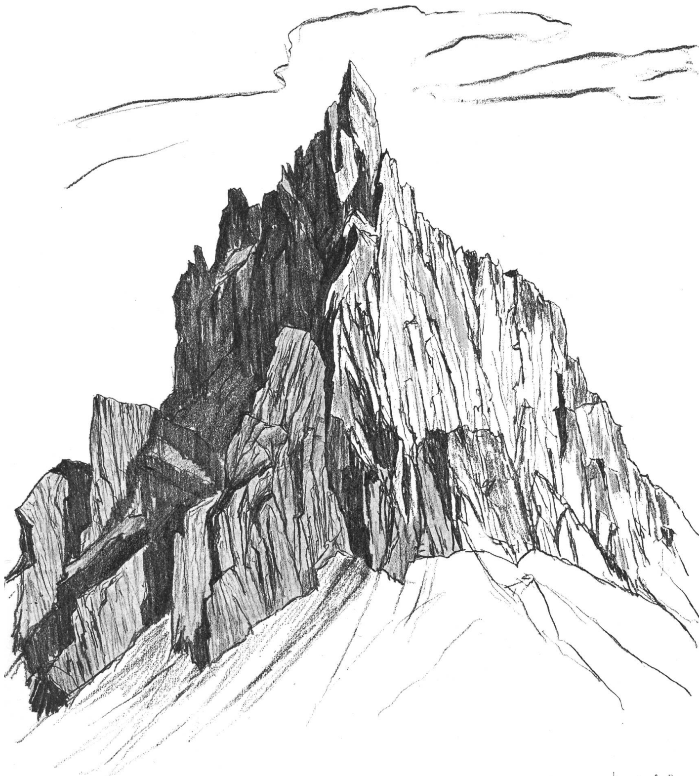
CIMON DELLA PALA