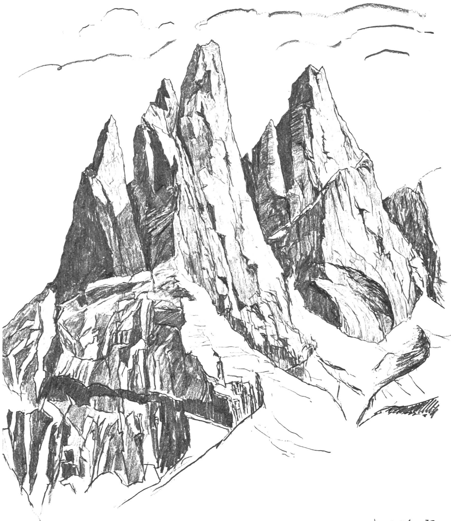
CAMPANILE BASSO DEI LASTEI , CAMPANILE DI MEZZO DEI LASTEI