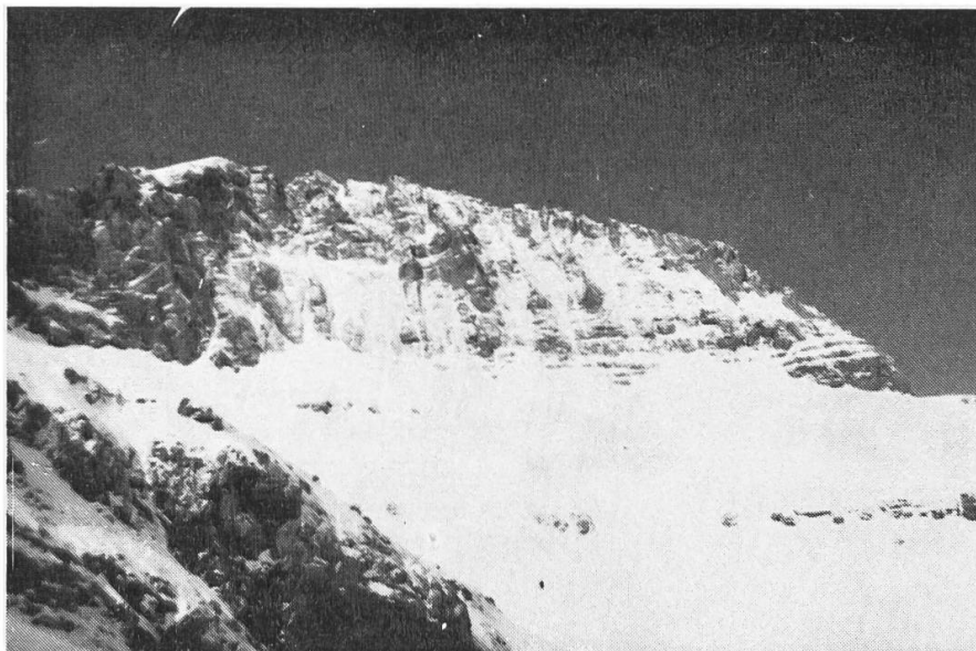
Stefani — Thron des Zeus 2909 m